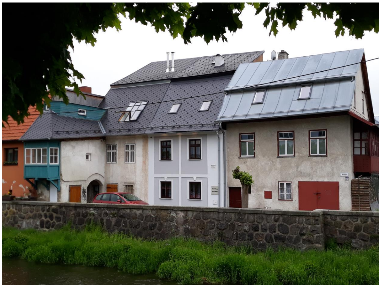
Židovský dům č.p. 1195, U Vody, Velké Meziříčí