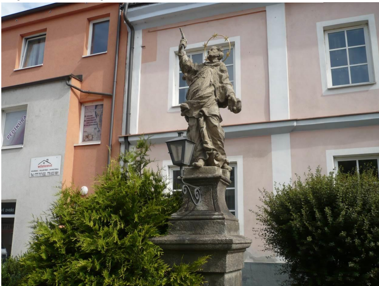
Socha sv. Jana Nepomuckého, Hornoměstská, Velké Meziříčí