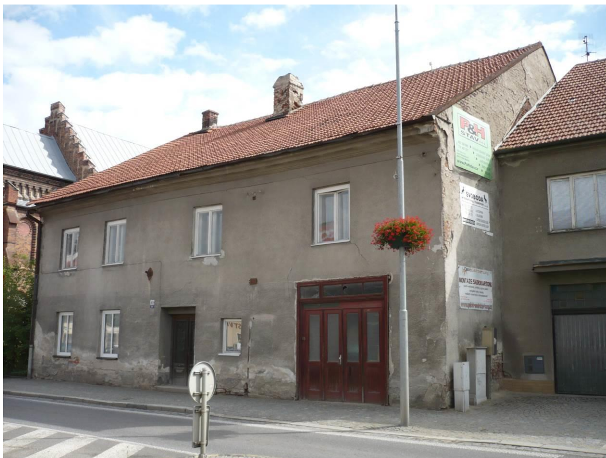
Židovský dům č.p. 100, Novosady, Velké Meziříčí

Výsledný efekt: zachování a lepší prezentace kulturně historických hodnot objektu, zlepšení stavebně technického stavu budovy