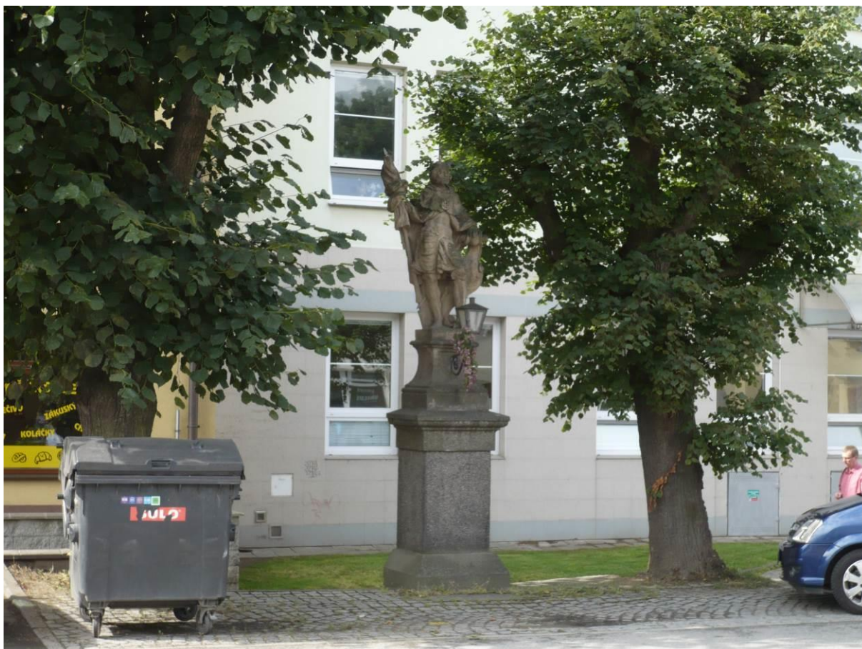
Socha sv. Václava, Hornoměstská, Velké Meziříčí