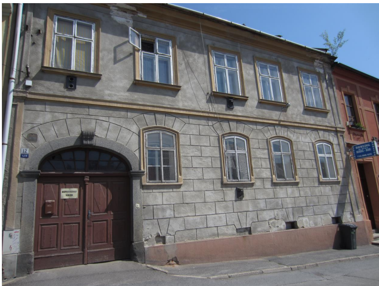
Předměstský dům č.p. 419, Hornoměstská, Velké Meziříčí

Výsledný efekt: zachování a lepší prezentace kulturně historických hodnot objektu, zlepšení stavebně technického stavu domu