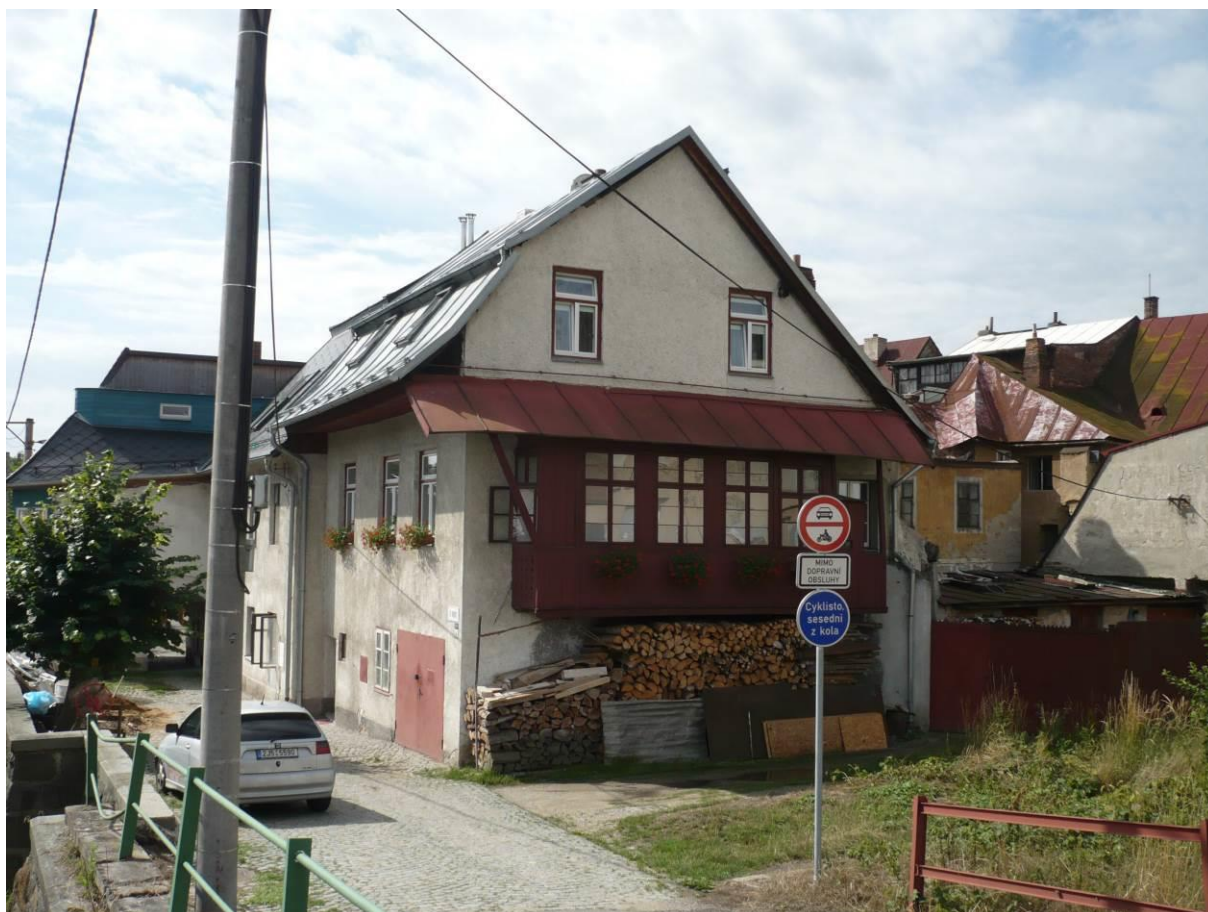
Židovský dům č.p. 1196, U Vody, Velké Meziříčí

Výsledný efekt: zachování kulturně historických hodnot objektu, zlepšení stavebně technického stavu budovy, zvýšení atraktivity lokality (bývalé židovské ghetto)