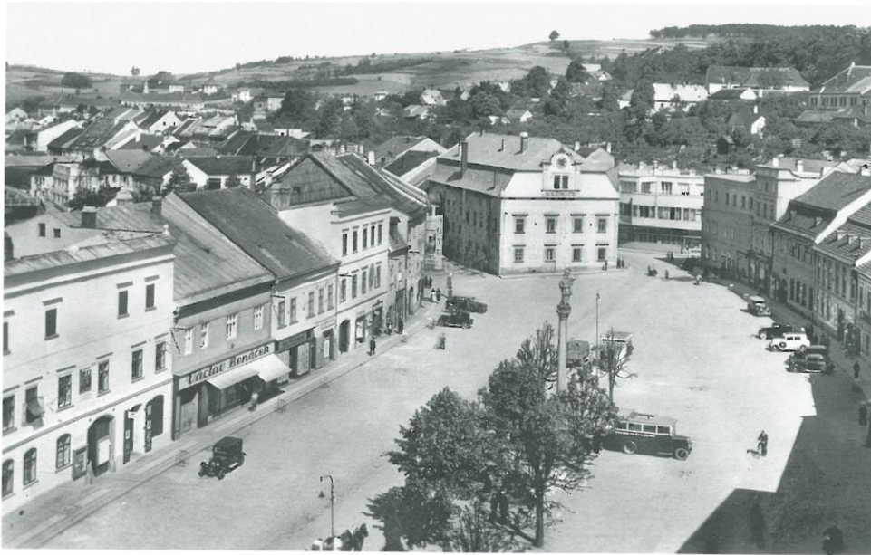
Obr. Pohled na náměstí z věže kostela sv. Mikuláše (30. léta 20. století)

Městem bylo Velké Meziříčí již ve druhé polovině 14. století, kdy k lokaci došlo nebylo zatím zjištěno. Kolem jádra se vyvinula četná předměstí. Kromě hradu představuje nejstarší architektonické doklady existence města farní kostel, vývojově nadmíru složitá stavba. Zazděný lomený portál lodi je raně gotický a prokazuje existenci kostela někdy ve třetí čtvrtině 13. století. Starší chrámová budova byla pak někdy k polovině 14. století význačně přestavěna a rozšířena. Vyrostl nynější presbytář a obdélná loď, k níž byla záhy připojena i masivní západní věž, hlavní dominanta historického jádra. Ještě ve 14. století přibyla velká jižní kaple s pětibokým závěrem. Toto velkorysé církevní podnikání bylo myslitelné rozhodně až v rámci města.