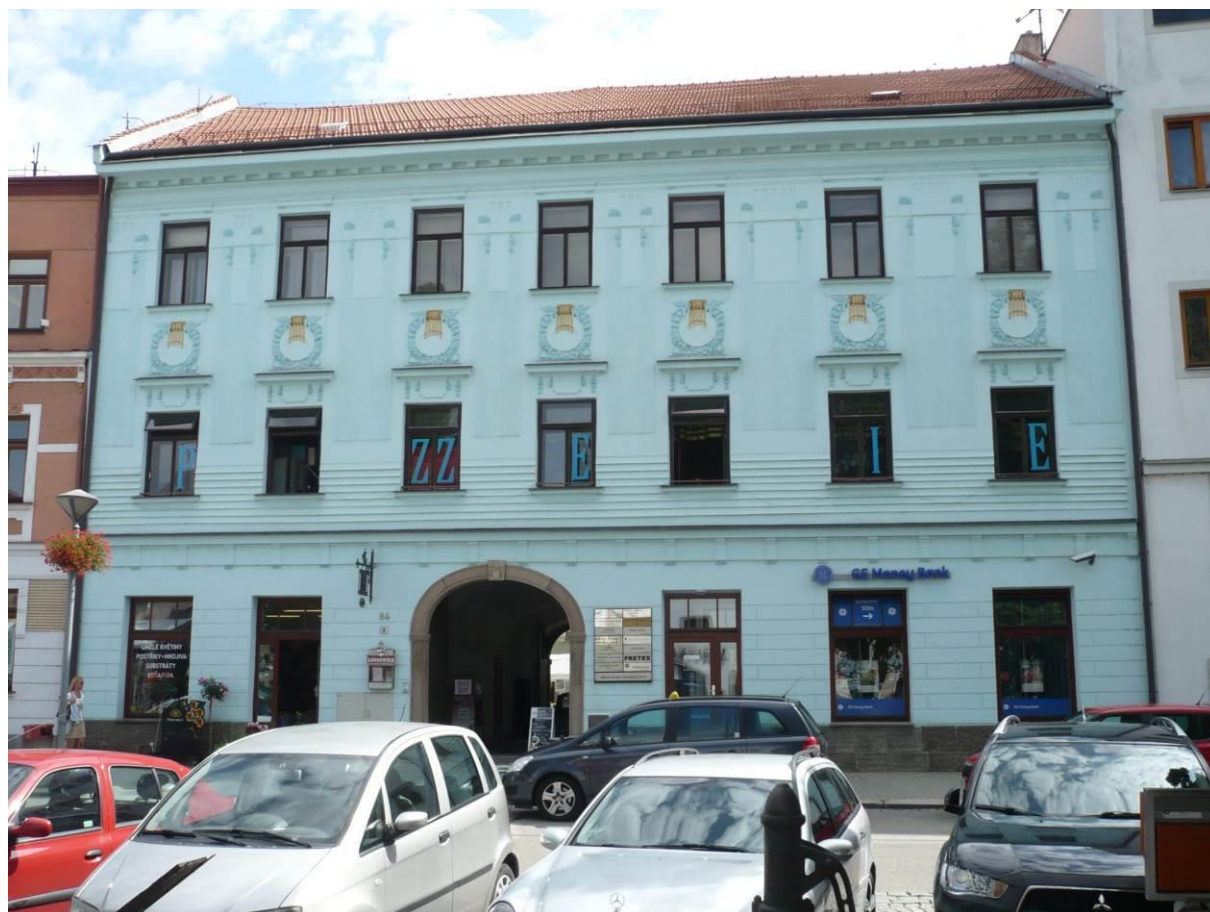
Měšťanský dům č.p. 84, Náměstí, Velké Meziříčí

Výsledný efekt: zachování a zlepšení prezentace kulturně historických hodnot objektu.