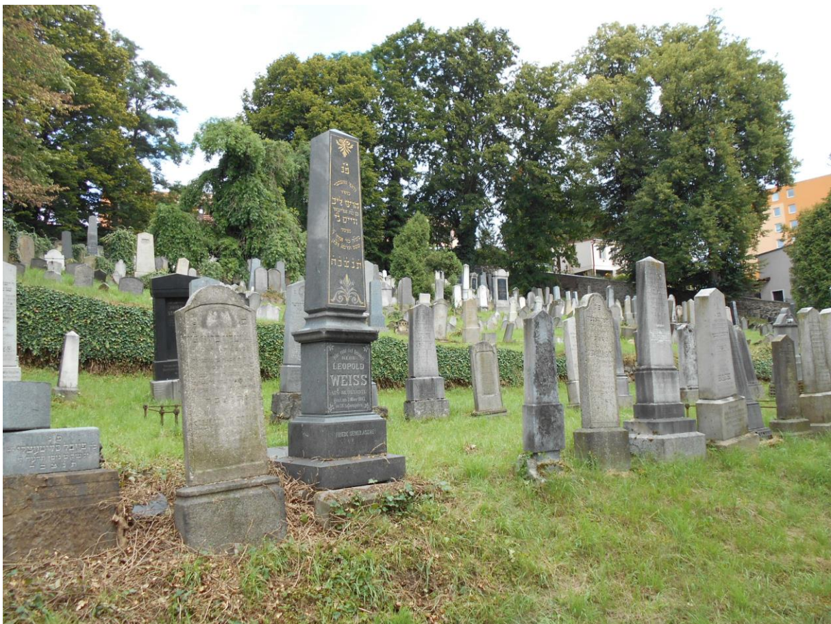
Židovský hřbitov, Velké Meziříčí

Výsledný efekt: zachování kulturně historických hodnot objektu, zlepšení stavu náhrobků – respektování charakteru pietního místa