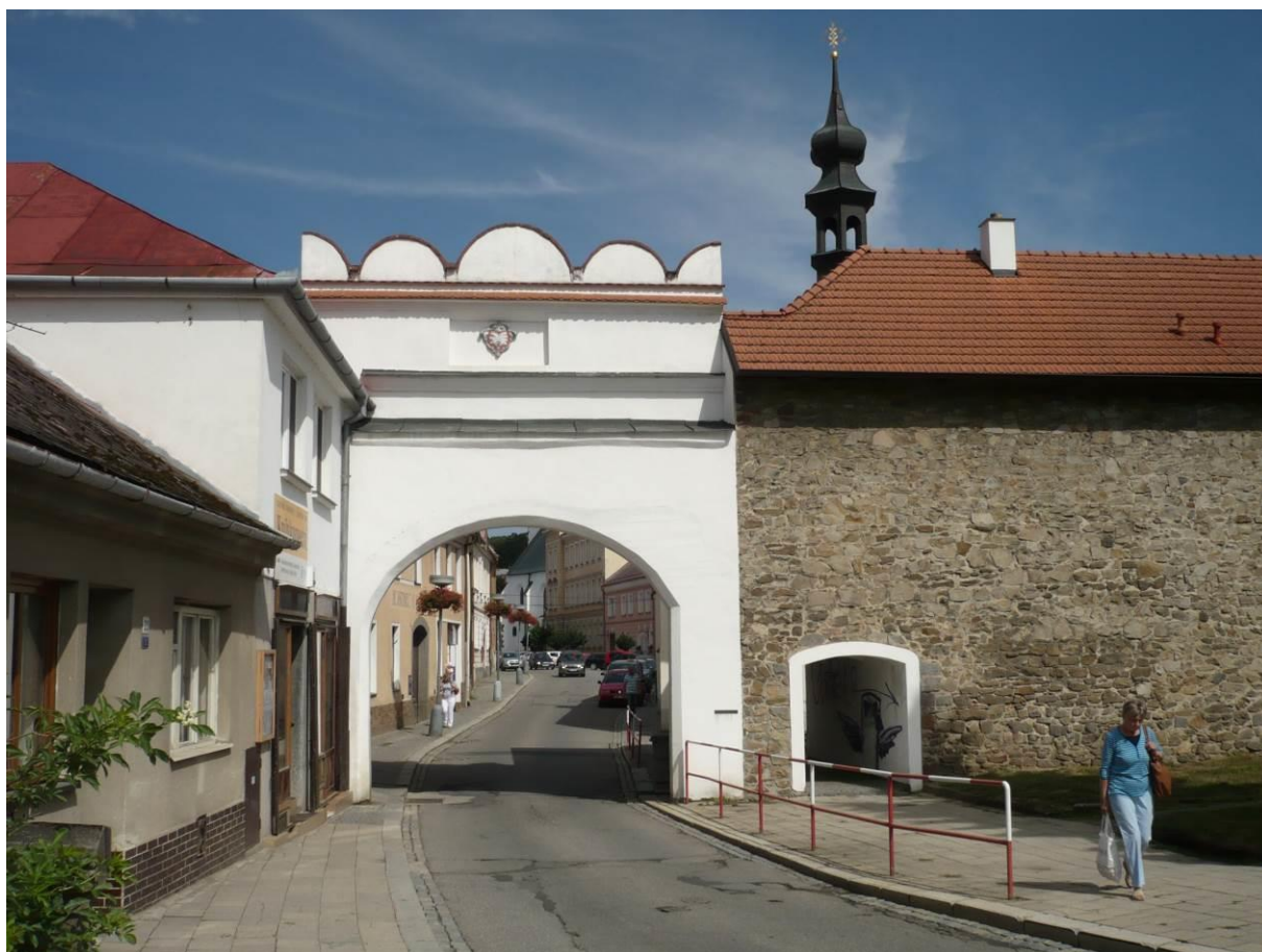
Dolní brána s částí hradby - Městské opevnění, Velké Meziříčí

Výsledný efekt: zachování a lepší prezentace kulturně historických hodnot objektu, zlepšení stavebně technického stavu