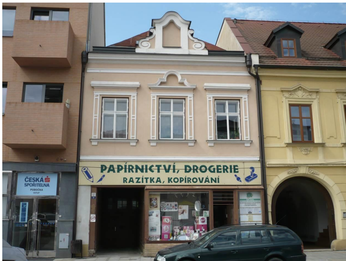
Měšťanský dům č.p. 15, Náměstí, Velké Meziříčí

Výsledný efekt: zachování a zlepšení prezentace kulturně historických hodnot objektu.