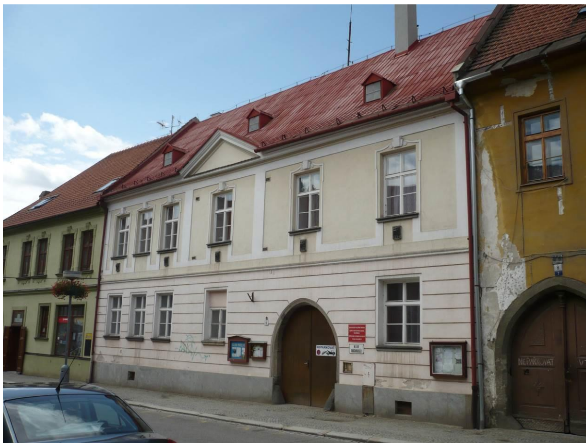
Městský dům č.p. 6, Komenského, Velké Meziříčí

Výsledný efekt: zachování a lepší prezentace kulturně historických hodnot objektu, zlepšení stavebně technického stavu domu