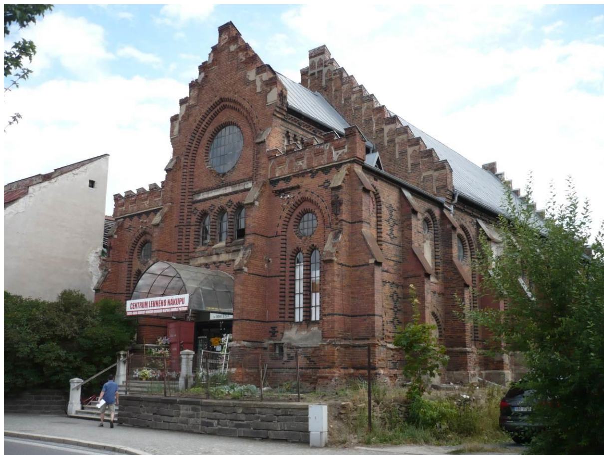
Nová synagoga, Novosady, Velké Meziříčí

Výsledný efekt: zachování kulturně historických hodnot objektu, zlepšení vzhledu, zvýšení atraktivnosti pro cestovní ruch.