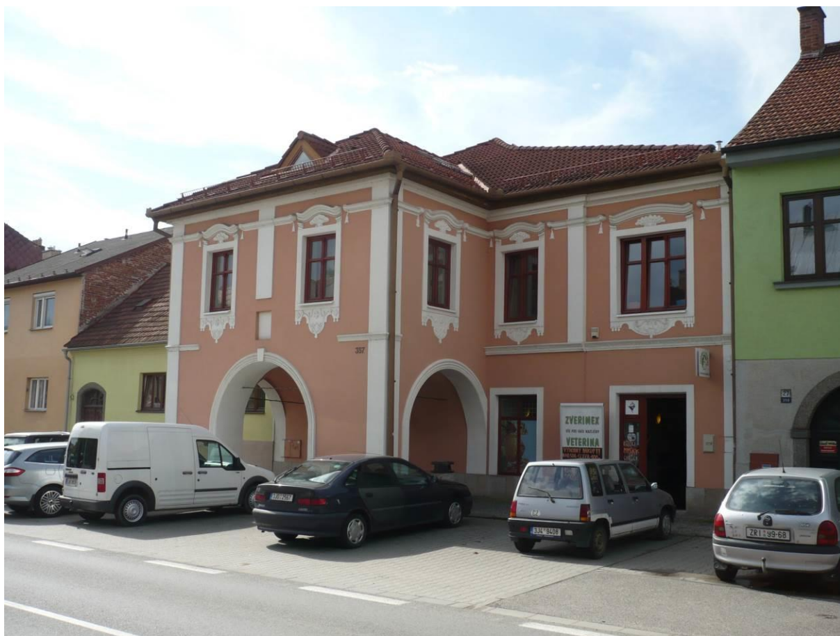
Měšťanský dům č.p. 357, Hornoměstská, Velké Meziříčí

Výsledný efekt: zachování a lepší prezentace kulturně historických hodnot objektu, zlepšení stavebně technického stavu domu