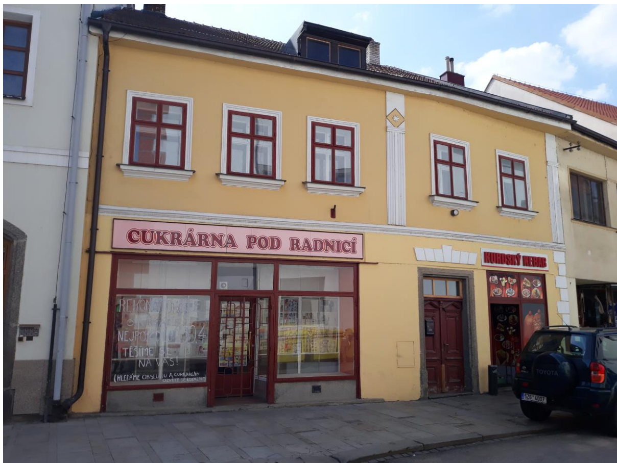
Městský dům č.p. 25, Náměstí, Velké Meziříčí