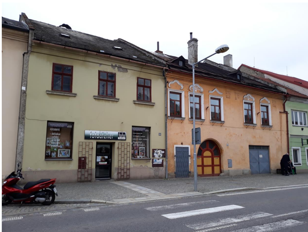
Židovské domy č.p. 1152 a 1156, Novosady, Velké Meziříčí

Výsledný efekt: zachování a lepší prezentace kulturně historických hodnot, zlepšení stavebně technického stavu domů