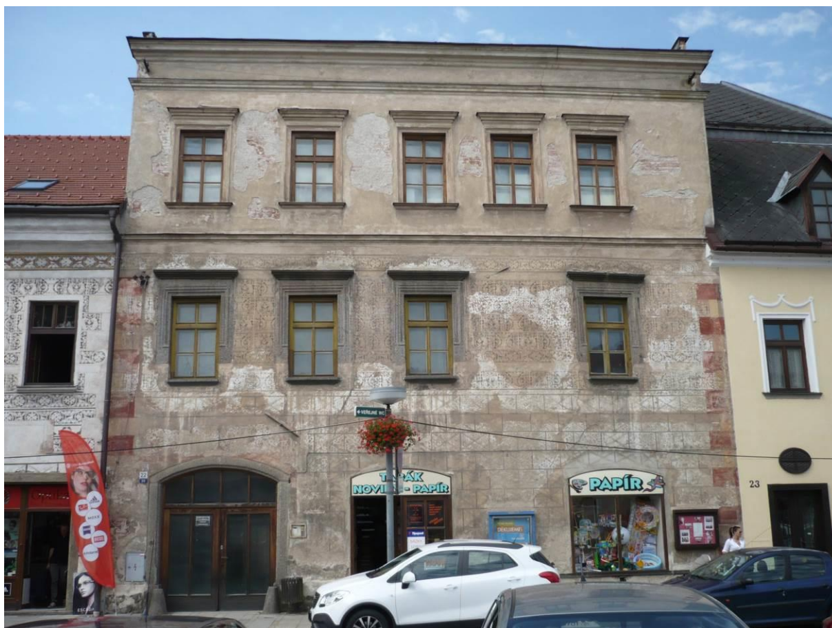
Měšťanský dům č.p. 20, Náměstí, Velké Meziříčí

Výsledný efekt: zachování a zlepšení prezentace kulturně historických hodnot objektu, zlepšení stavebně technického stavu domu.