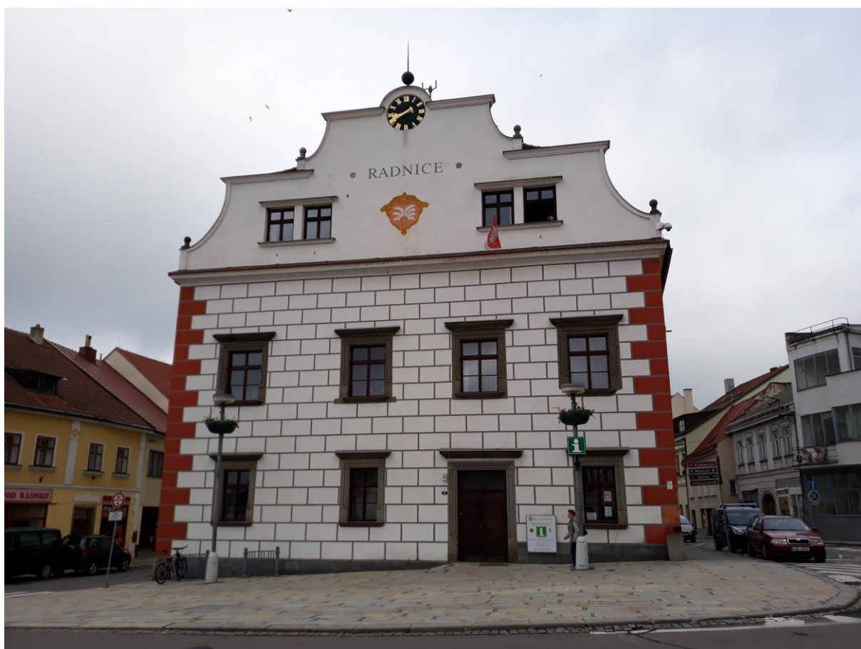
Radnice č.p. 29, Náměstí, Velké Meziříčí

Výsledný efekt: odstranění stavebně technických nedostatků, zachování kulturně historických hodnot objektu, zlepšení vzhledu, zvýšení atraktivnosti pro cestovní ruch.