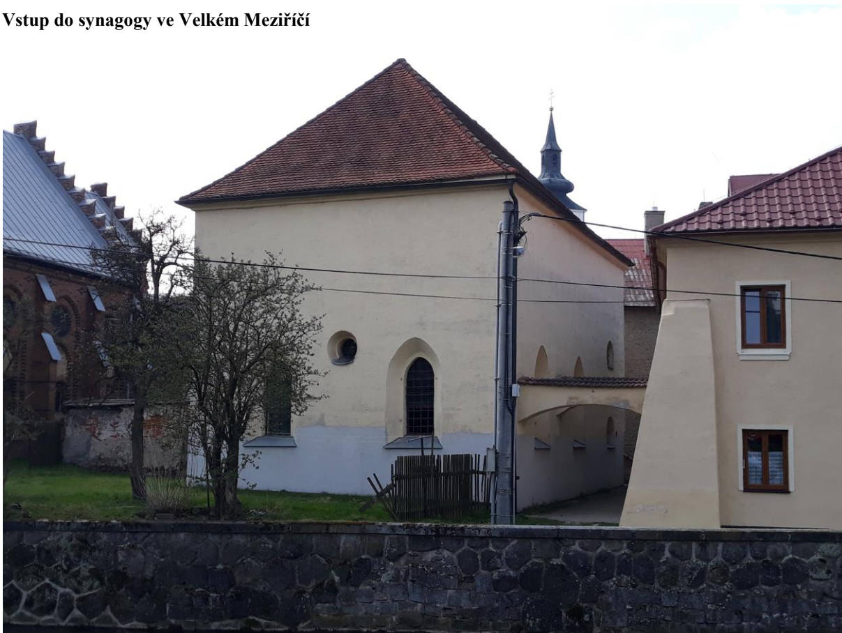
Východní strana synagogy ve Velkém Meziříčí