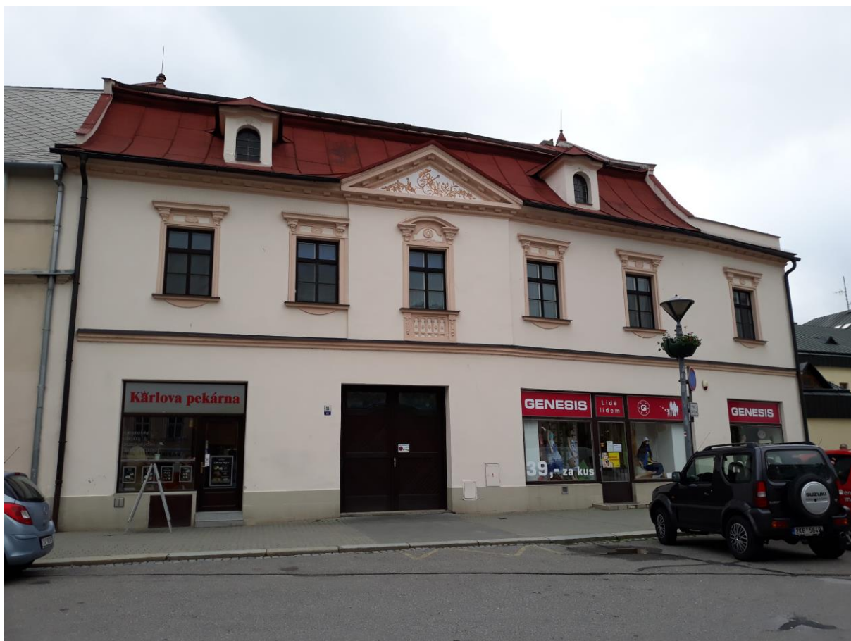
Měšťanský dům č.p. 87, Náměstí, Velké Meziříčí

Výsledný efekt: zachování a zlepšení prezentace kulturně historických hodnot objektu.