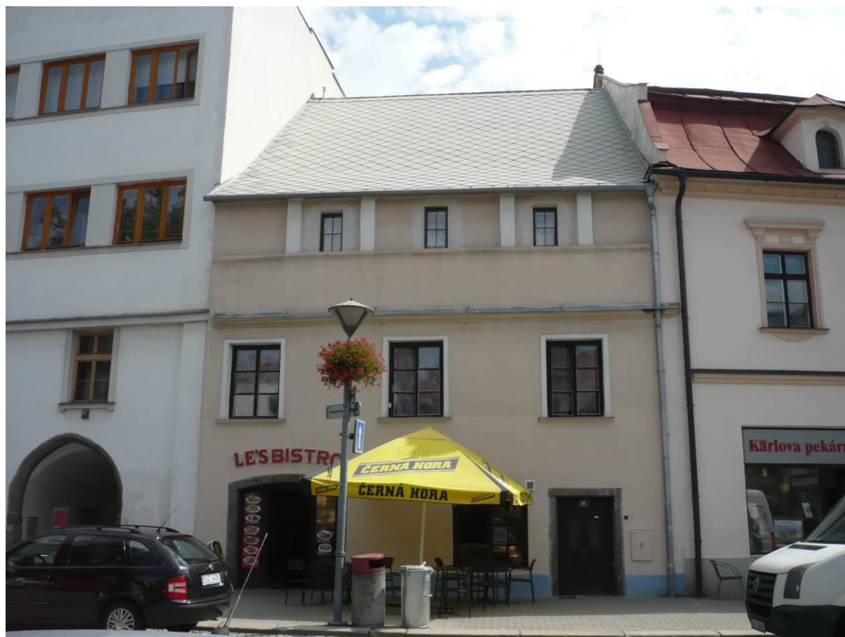
Měšťanský dům č.p. 86, Náměstí, Velké Meziříčí

Výsledný efekt: zachování a zlepšení prezentace kulturně historických hodnot objektu.