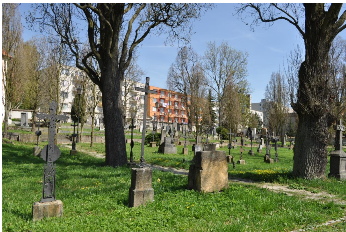
Hřbitov na Moráni, Velké Meziříčí

Výsledný efekt: zachování kulturně historických hodnot objektu, zlepšení vzhledu, zvýšení atraktivnosti pro cestovní ruch