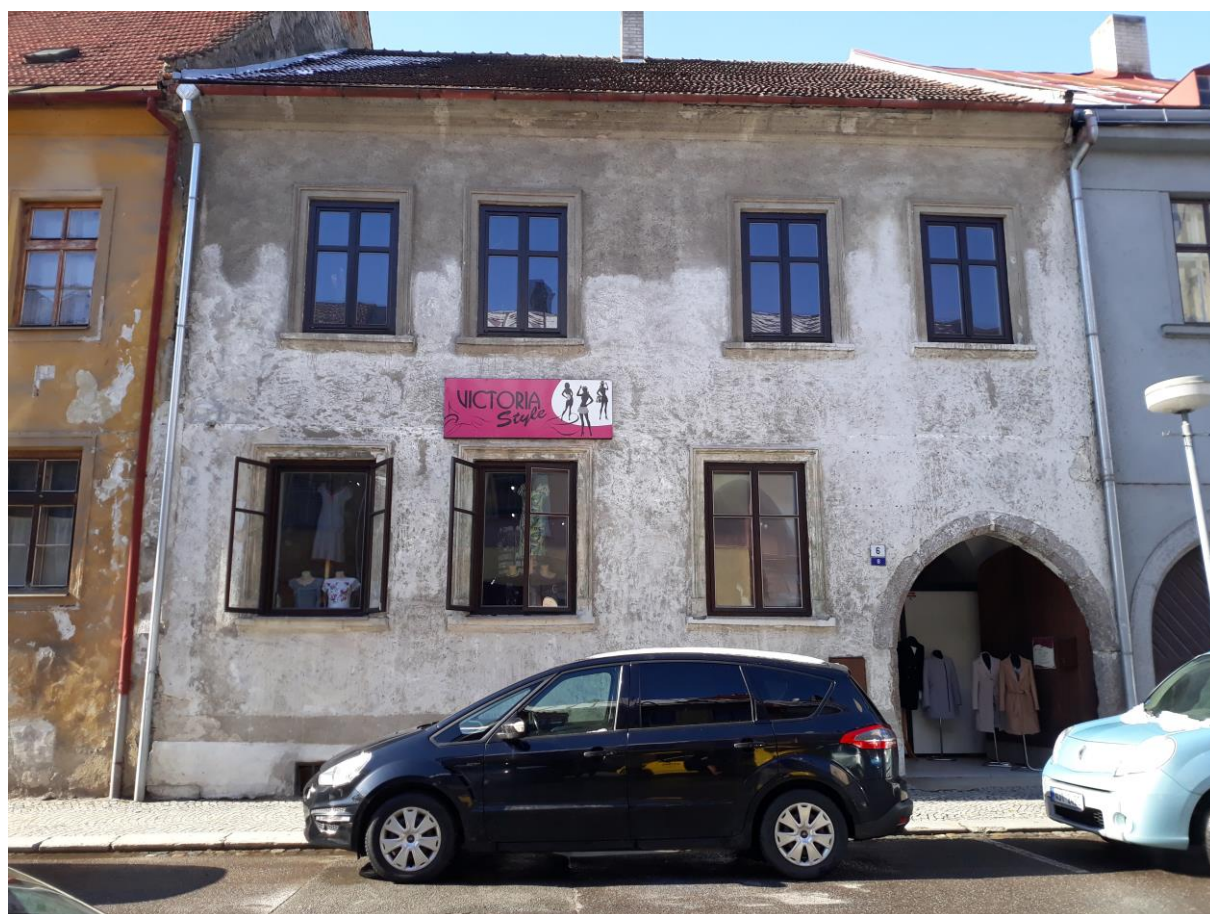
Městský dům č.p. 8, Komenského, Velké Meziříčí

Výsledný efekt: zachování a zlepšení prezentace kulturně historických hodnot objektu, zlepšení stavebně technického stavu domu