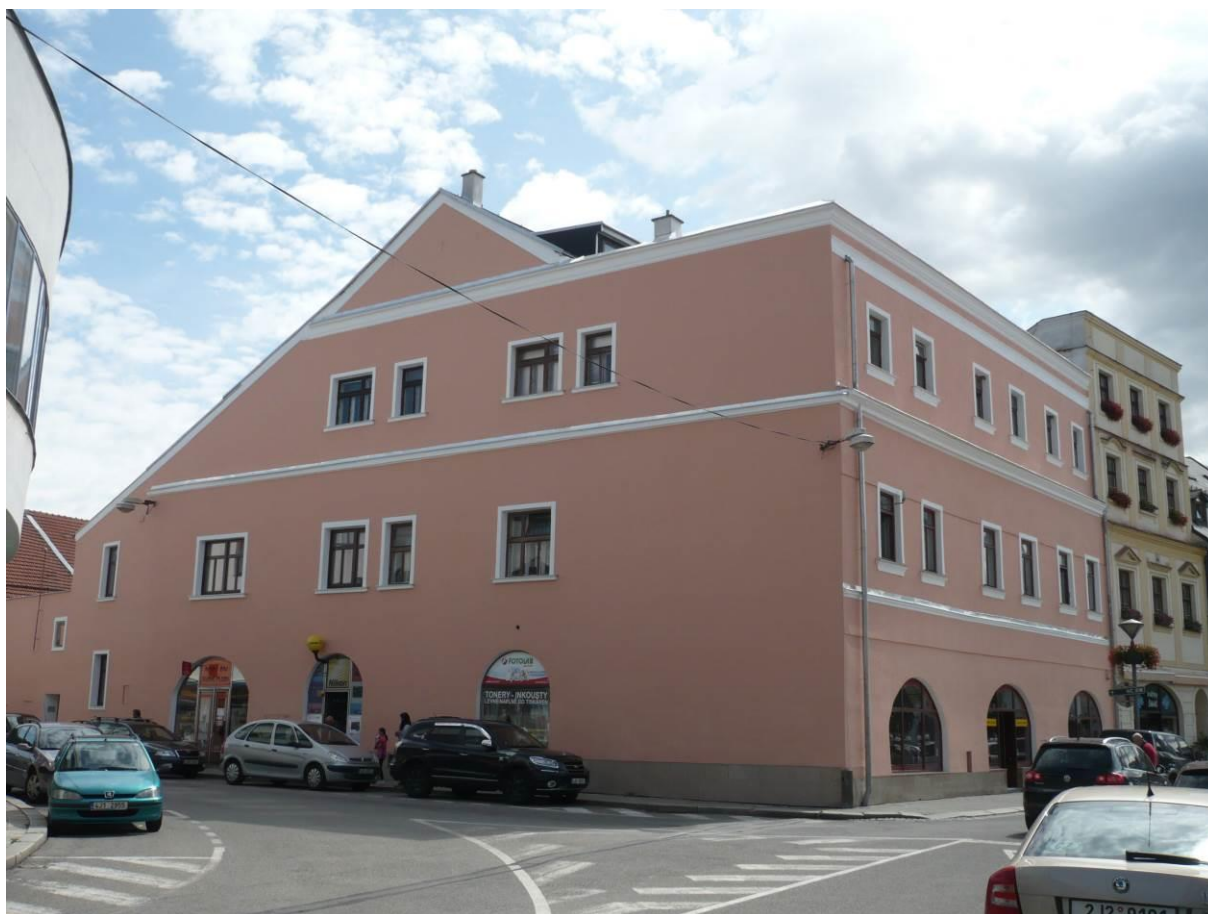
Měšťanský dům č.p. 77, Náměstí, Velké Meziříčí

Výsledný efekt: odstranění stavebně technických nedostatků, zachování a prezentace kulturně historických hodnot objektu.