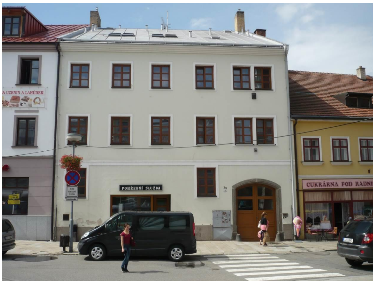
Měšťanský dům č.p. 24, Náměstí, Velké Meziříčí

Výsledný efekt: zachování kulturně historických hodnot objektu