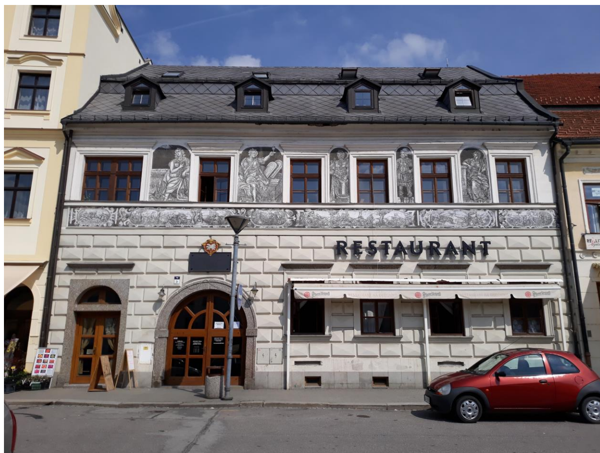
Měšťanský dům č.p. 79 (Obecník), Náměstí, Velké Meziříčí

Výsledný efekt: zachování kulturně historických hodnot objektu, lepší vzhled.