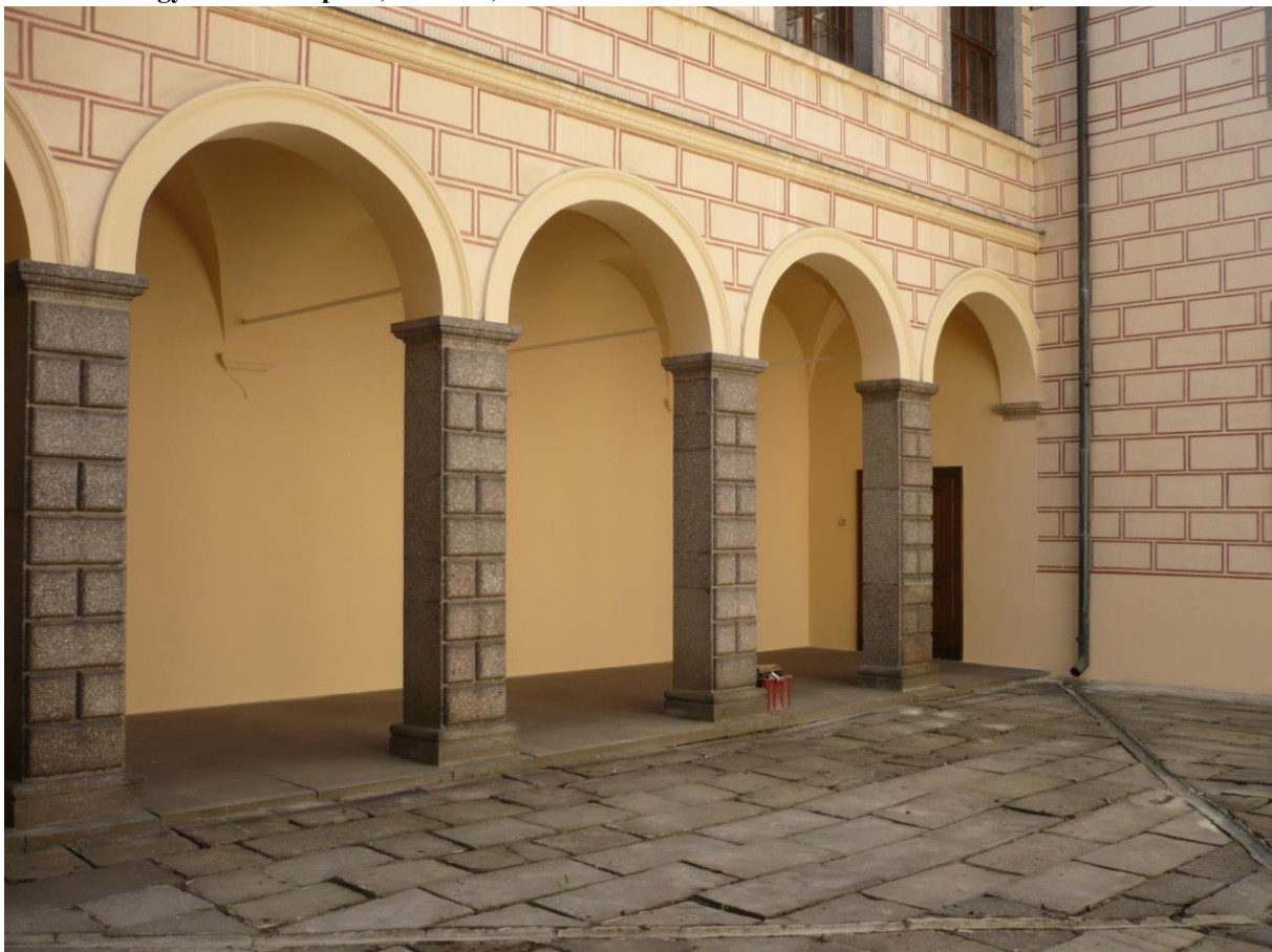
Vnitřní nádvoří Luteránského gymnázia č.p. 11, Náměstí, Velké Meziříčí