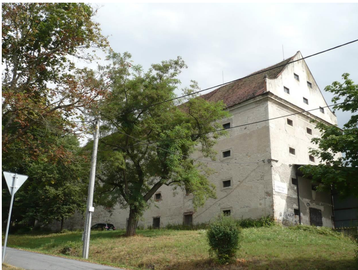
Sýpka, č.p. 1234, Velké Meziříčí

Výsledný efekt: zachování kulturně historických hodnot objektu, zlepšení vzhledu, zvýšení pravděpodobnosti nalezení vhodnějšího způsobu využití (např. výstavní prostory)