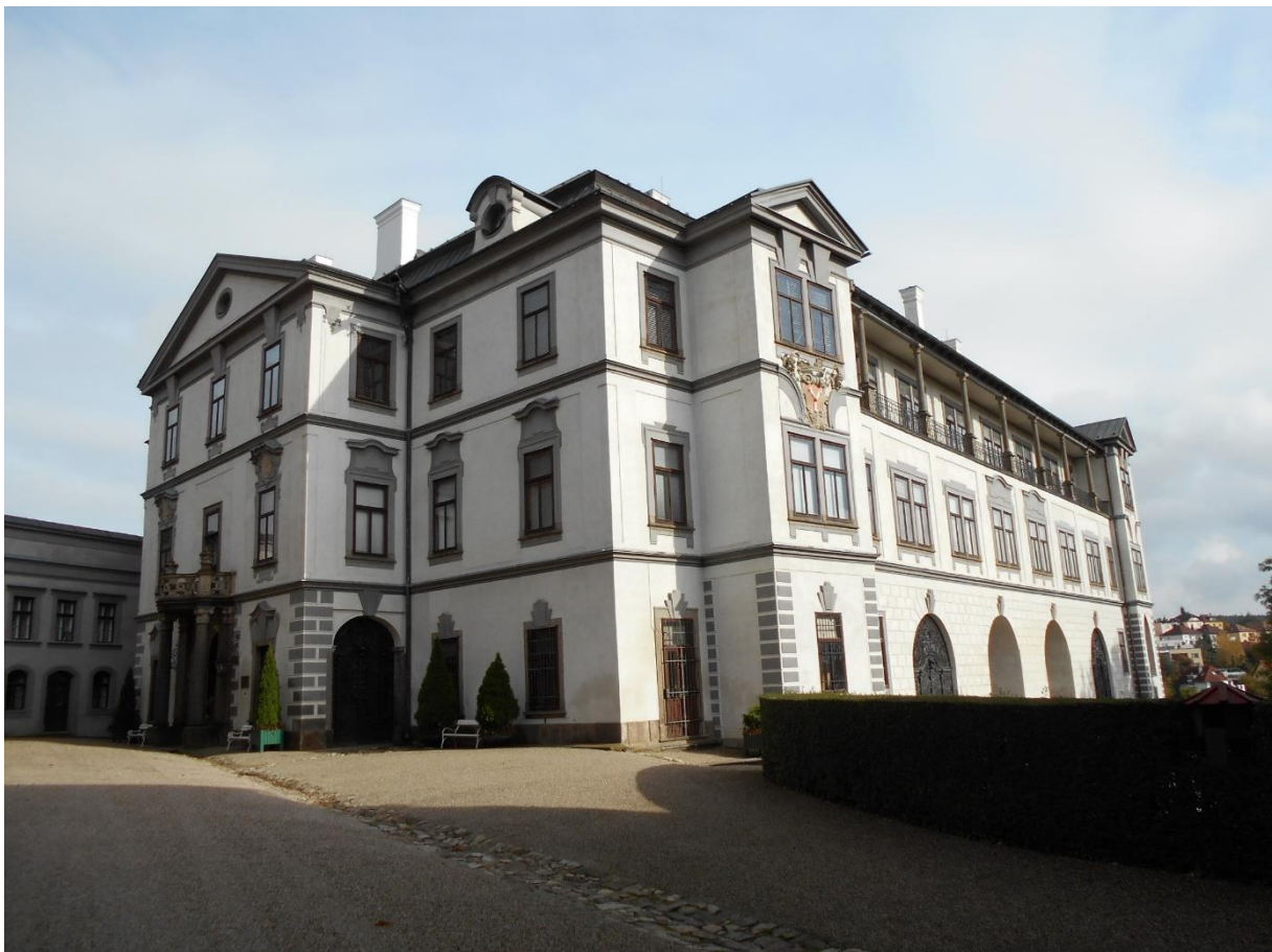
Zámek ve Velkém Meziříčí

Vlastníci kromě mimořádných výdajů na akce obnovy (rekonstrukce střechy, jednotlivé etapy opravy fasády, atd.) investují do pravidelně prováděné běžné údržby cca 250 000,- Kč ročně.