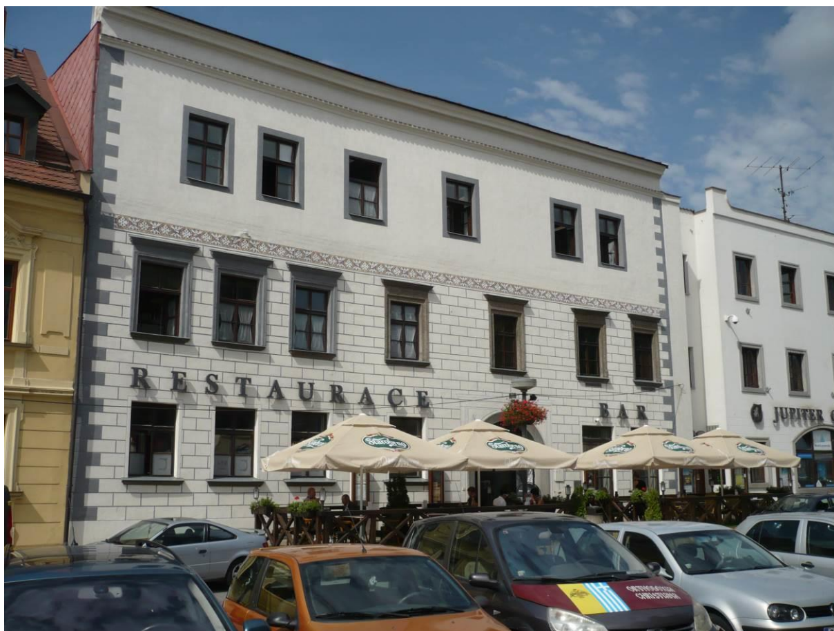
Městský dům č.p. 17, Náměstí, Velké Meziříčí

Výsledný efekt: zachování a zlepšení prezentace kulturně historických hodnot, zlepšení stavebně technického stavu domu, který je společenským a kulturním centrem města