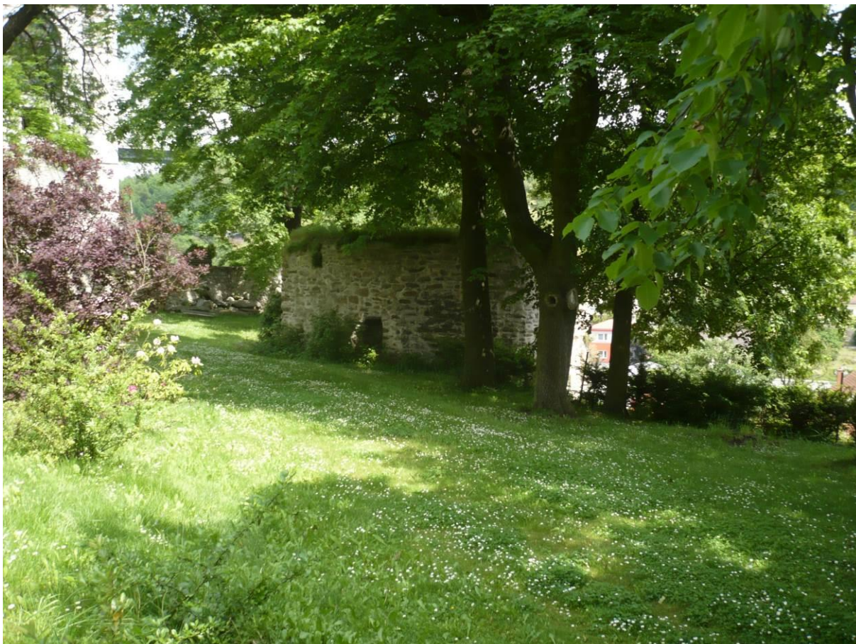
Tábořská brána, areál zámku ve Velkém Meziříčí