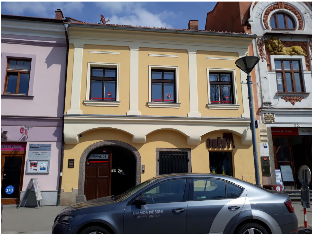
Měšťanský dům č.p. 82, Náměstí, Velké Meziříčí

Výsledný efekt: zachování a zlepšení prezentace kulturně historických hodnot objektu.