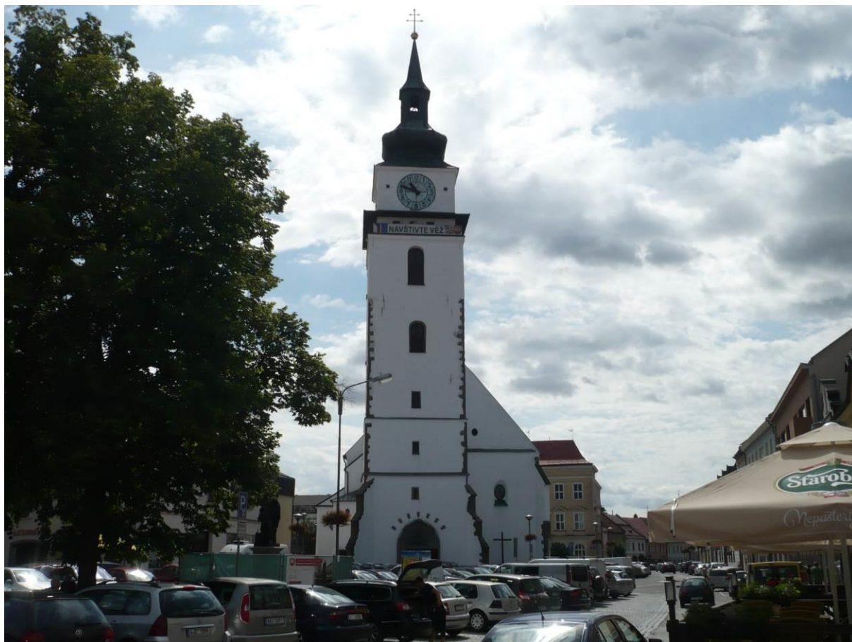
Pohled z náměstí na věž kostela sv. Mikuláše ve Velkém Meziříčí

Výsledný efekt: zachování kulturně historických hodnot objektu, zlepšení vzhledu - dominanta náměstí, města a okolí, místo konání církevních i kulturních akcí.