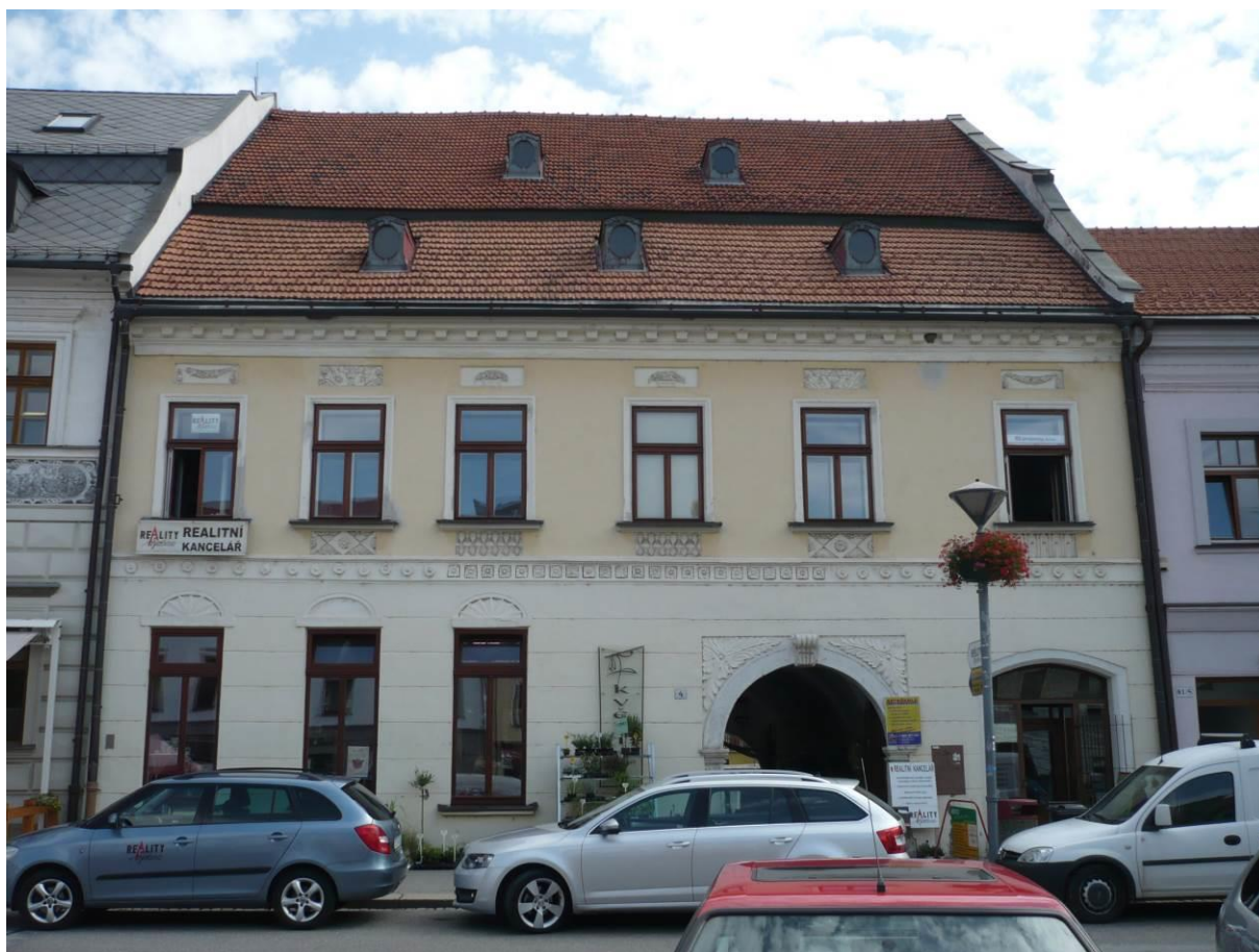
Měšťanský dům č.p. 80, Náměstí, Velké Meziříčí

Výsledný efekt: zachování kulturně historických hodnot objektu, lepší vzhled