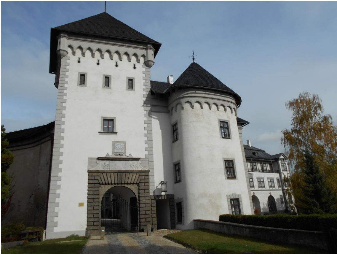
Vstupní věž zámku ve Velkém Meziříčí