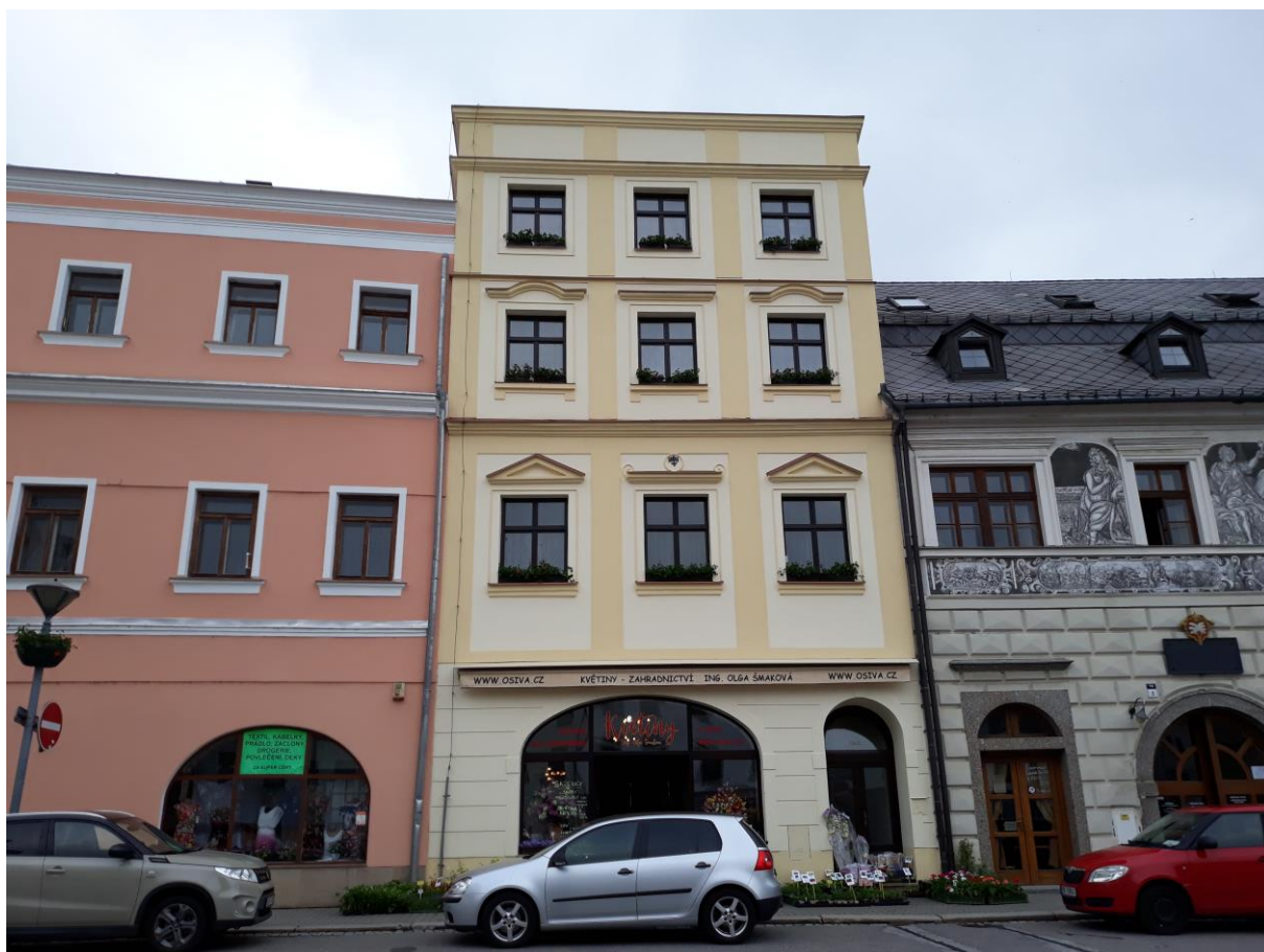
Měšťanský dům č.p. 78, Náměstí, Velké Meziříčí

Výsledný efekt: odstranění stavebně technických nedostatků, zlepšení vzhledu