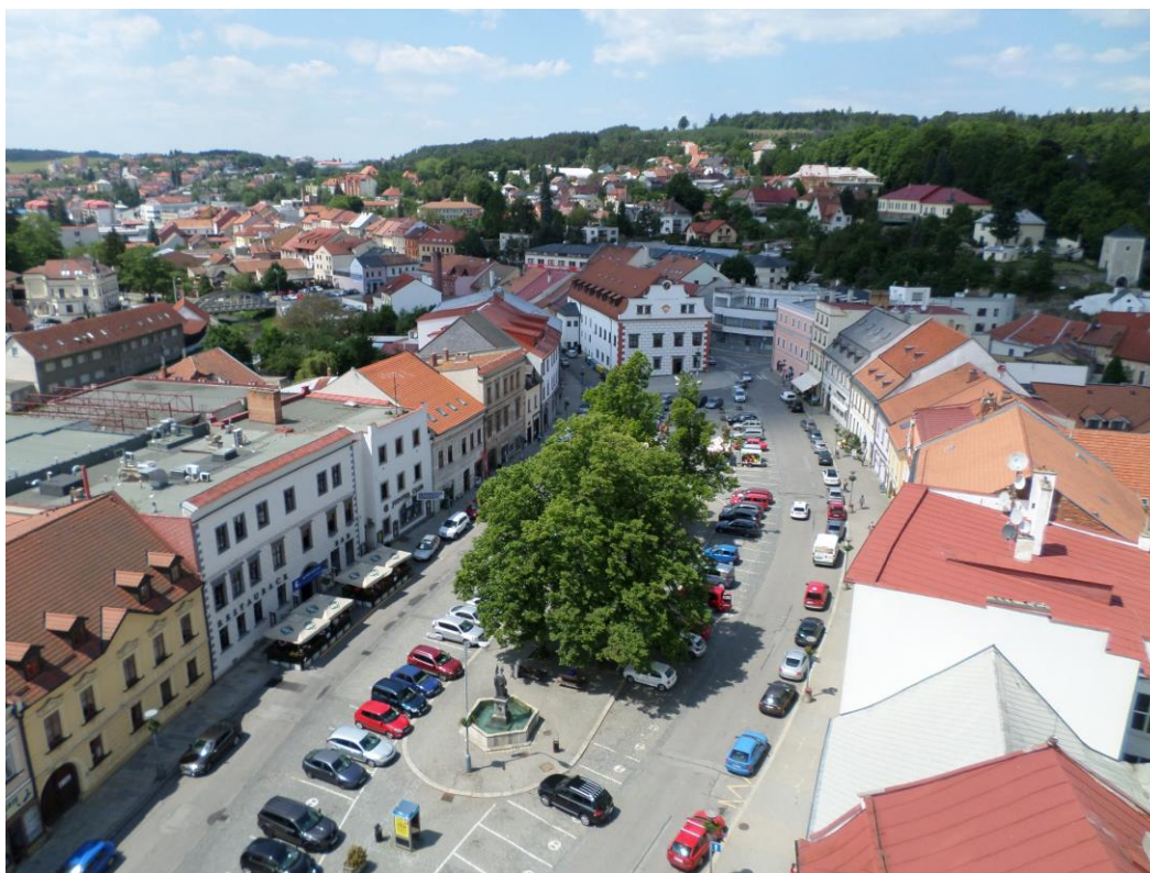
Obr. Pohled na náměstí z věže kostela sv. Mikuláše (2017)

Situace historické části Velkého Meziříčí umožňuje velkorysý rozvoj nové výstavby vně jádra po obou bocích, aniž by byly jeho panoramatické hodnoty výrazně narušeny. Historicko-urbanistický význam Velkého Meziříčí plně zdůvodňuje jeho zařazení mezi městské památkové zóny.