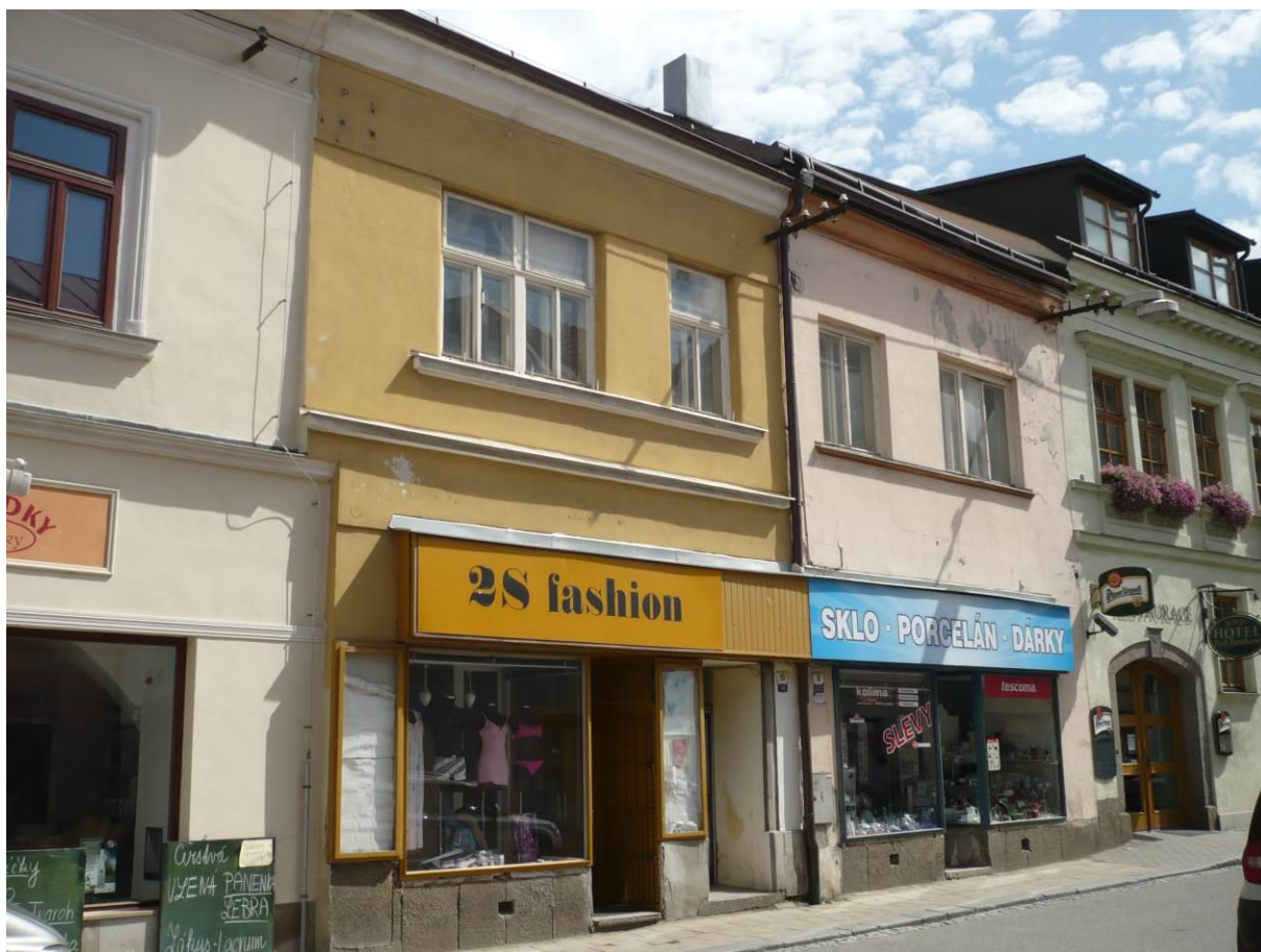
Městský dům se sklepem – dům č.p. 46 a 635, Radnická, Velké Meziříčí

Výsledný efekt: zachování a lepší prezentace kulturně historických hodnot objektu, zlepšení stavebně technického stavu