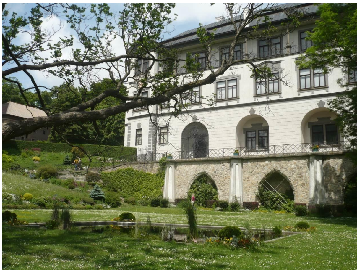
Zámecká zahrada, areál zámku ve Velkém Meziříčí

Vlastníci investují do pravidelně prováděné běžné údržby cca 200.00,- Kč ročně.