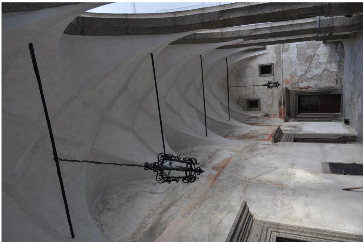
Arkáda na vnitřním nádvoří zámku ve Velkém Meziříčí