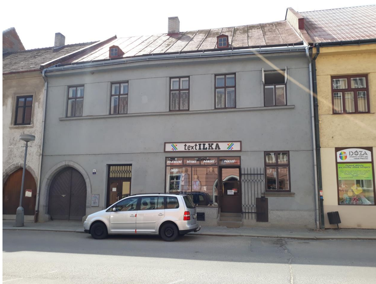
Městský dům č.p. 9, Komenského, Velké Meziříčí

Výsledný efekt: zachování a zlepšení prezentace kulturně historických hodnot objektu, zlepšení stavebně technického stavu domu