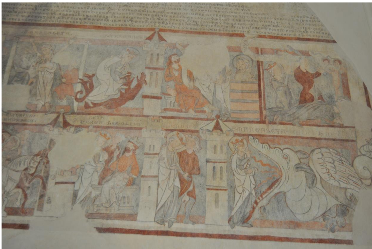
Malířská výzdoba rytířského sálu na zámku ve Velkém Meziříčí