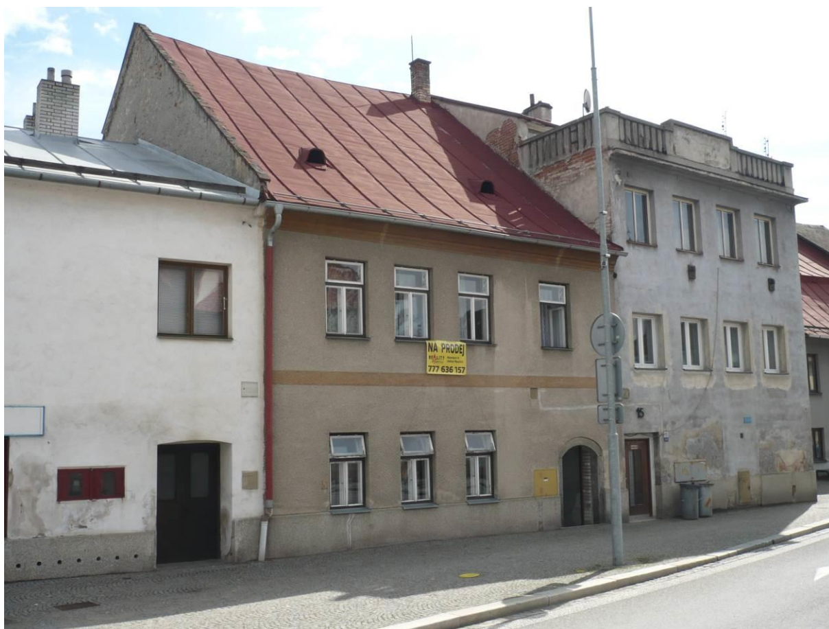
Židovský dům č.p. 1191, Novosady, Velké Meziříčí

Výsledný efekt: zachování a lepší prezentace kulturně historických hodnot objektu, zlepšení stavebně technického stavu budovy