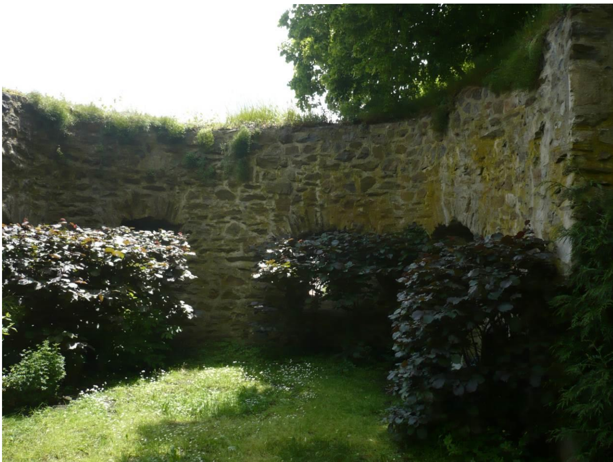
Tábořská brána, areál zámku ve Velkém Meziříčí