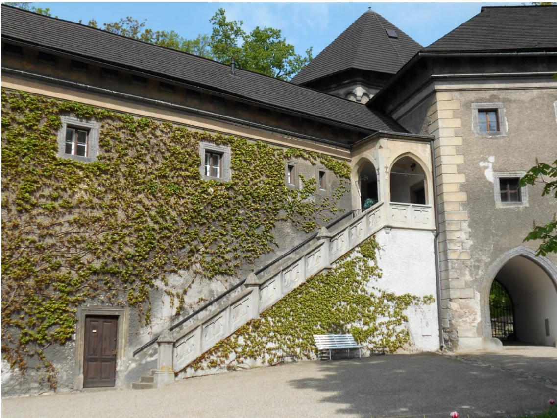
Část předzámčí a velkého nádvoří zámku ve Velkém Meziříčí