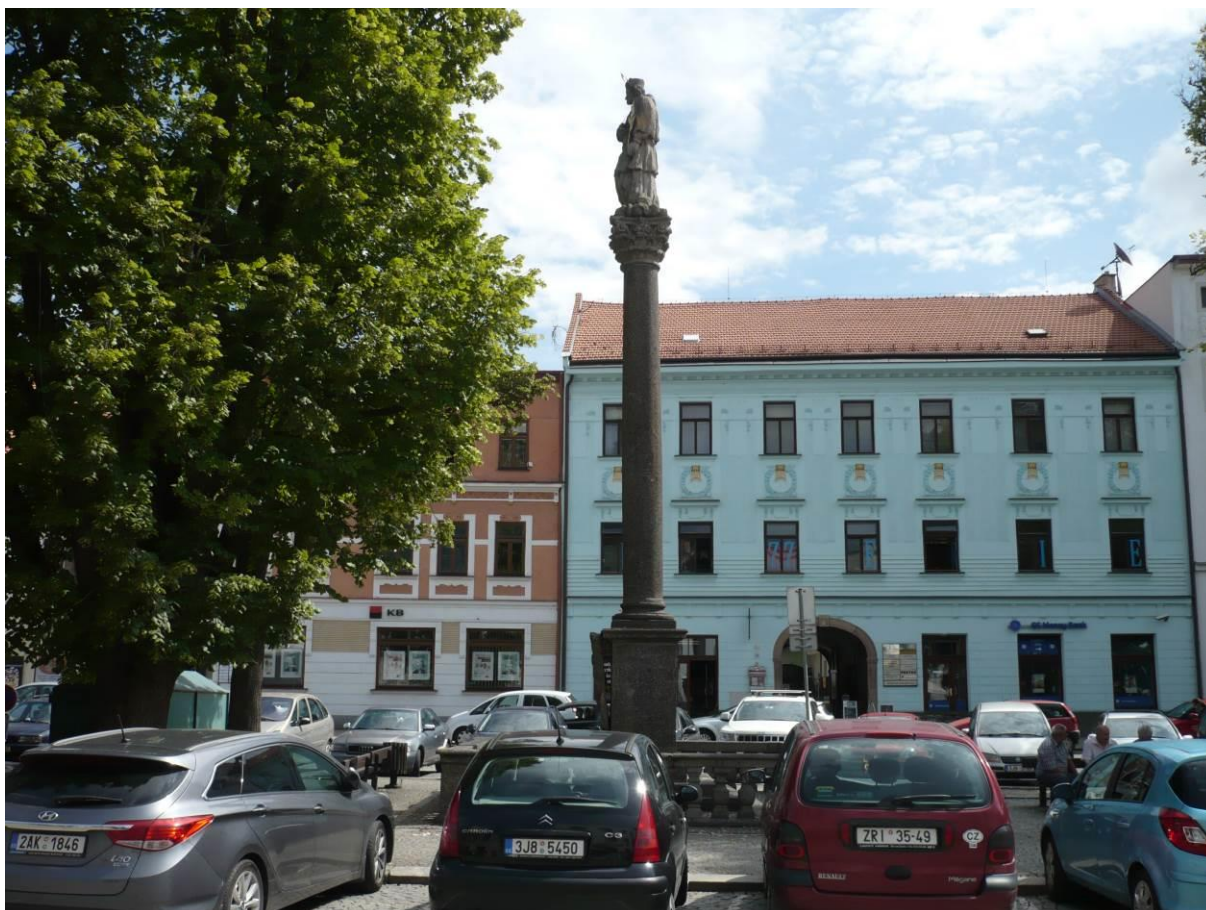
Sloup se sochou sv. Jana Nepomuckého, Náměstí, Velké Meziříčí