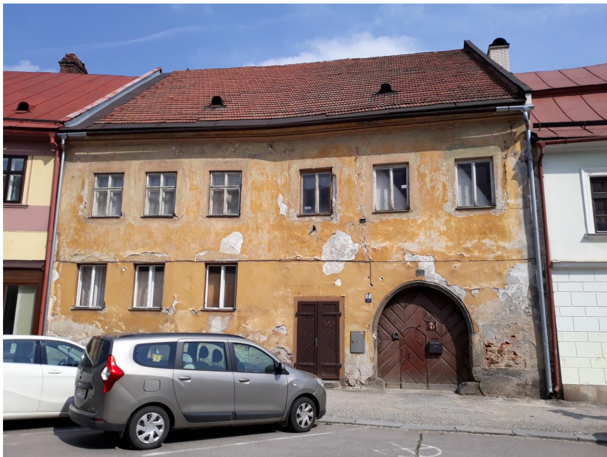
Městský dům č.p. 120, Komenského, Velké Meziříčí

Výsledný efekt: zachování a zlepšení prezentace kulturně historických hodnot objektu, zlepšení stavebně technického stavu domu