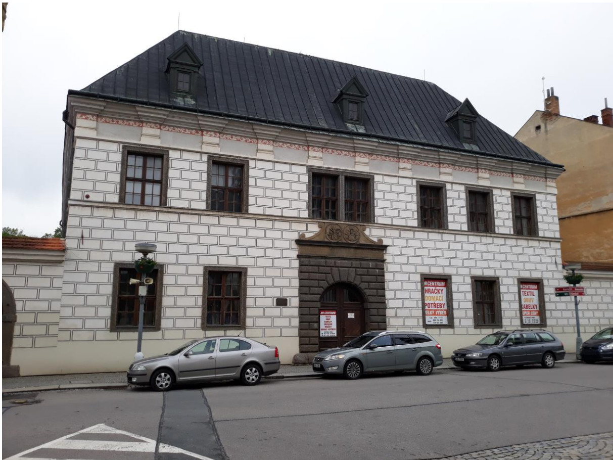
Luteránské gymnázium č.p. 11, Náměstí, Velké Meziříčí