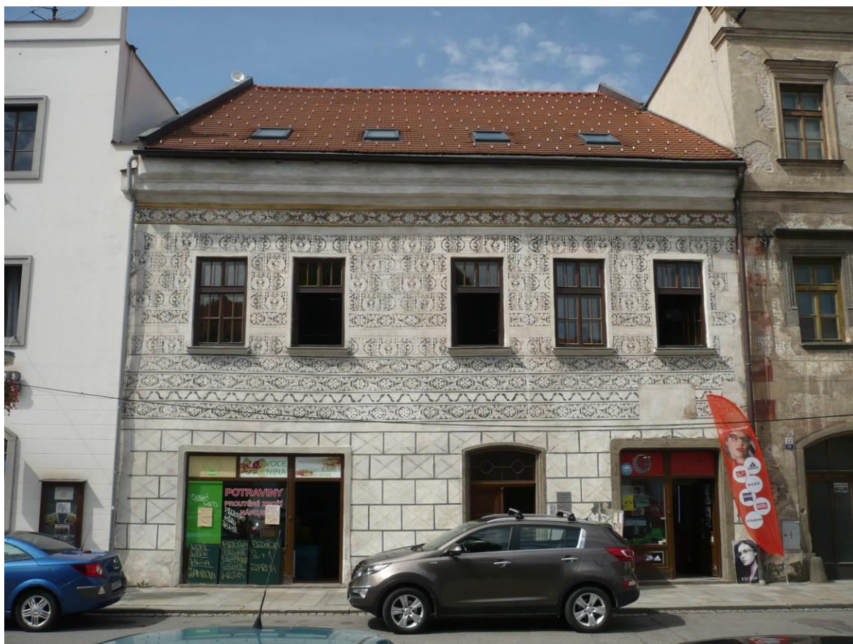
Městský dům č.p. 19, Náměstí, Velké Meziříčí

Výsledný efekt: zachování prezentace kulturně historických hodnot objektu.