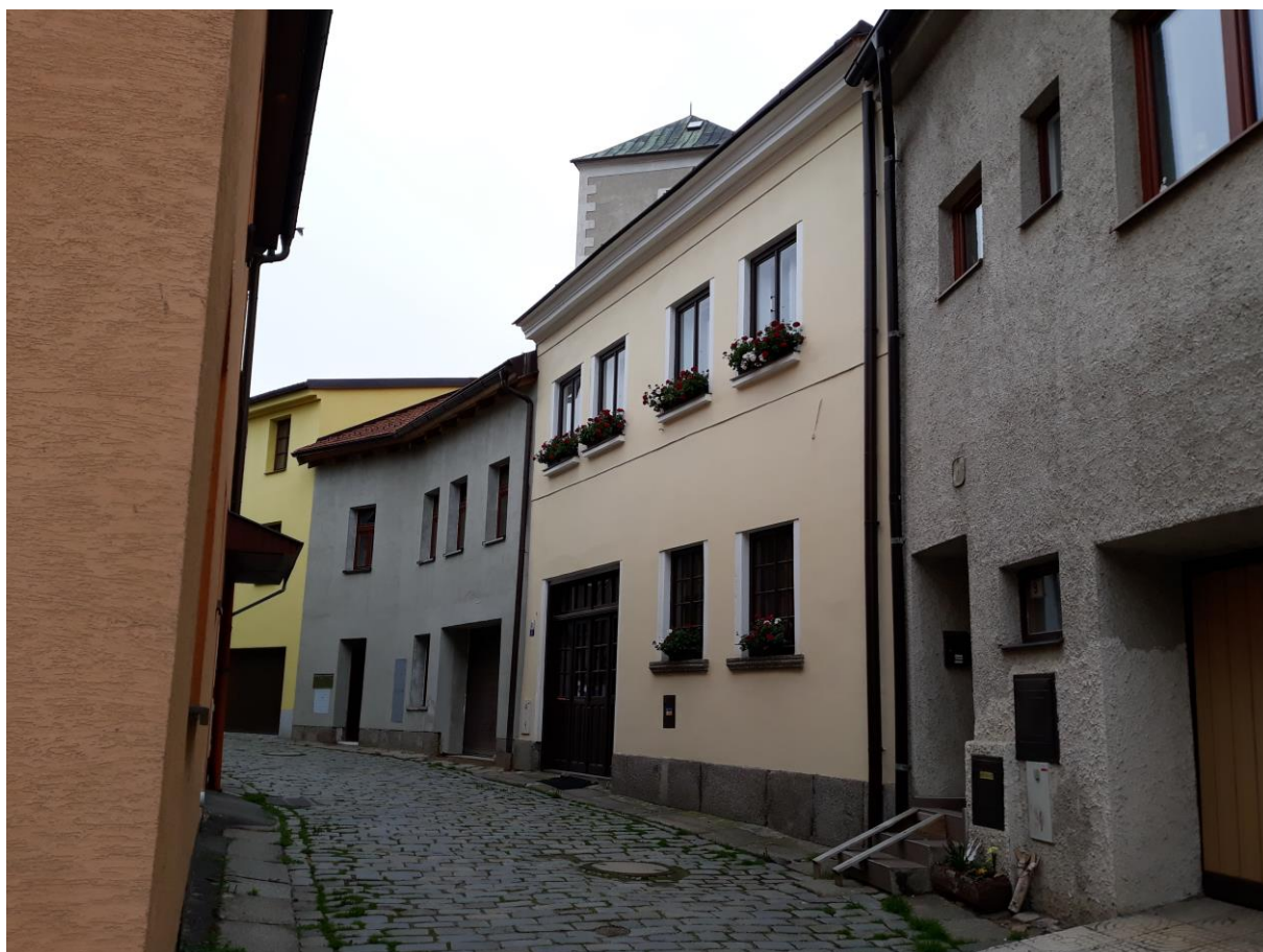
Městský dům č.p. 60, Podhradí, Velké Meziříčí

Výsledný efekt: zachování a lepší prezentace kulturně historických hodnot objektu, zlepšení stavebně technického stavu budovy