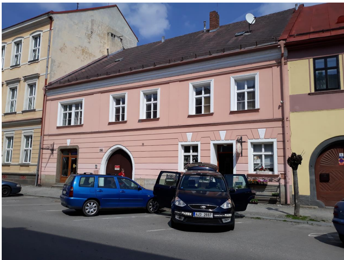
Městský dům č.p. 118, Komenského, Velké Meziříčí

Výsledný efekt: zachování a zlepšení prezentace kulturně historických hodnot objektu, zlepšení stavebně technického stavu domu