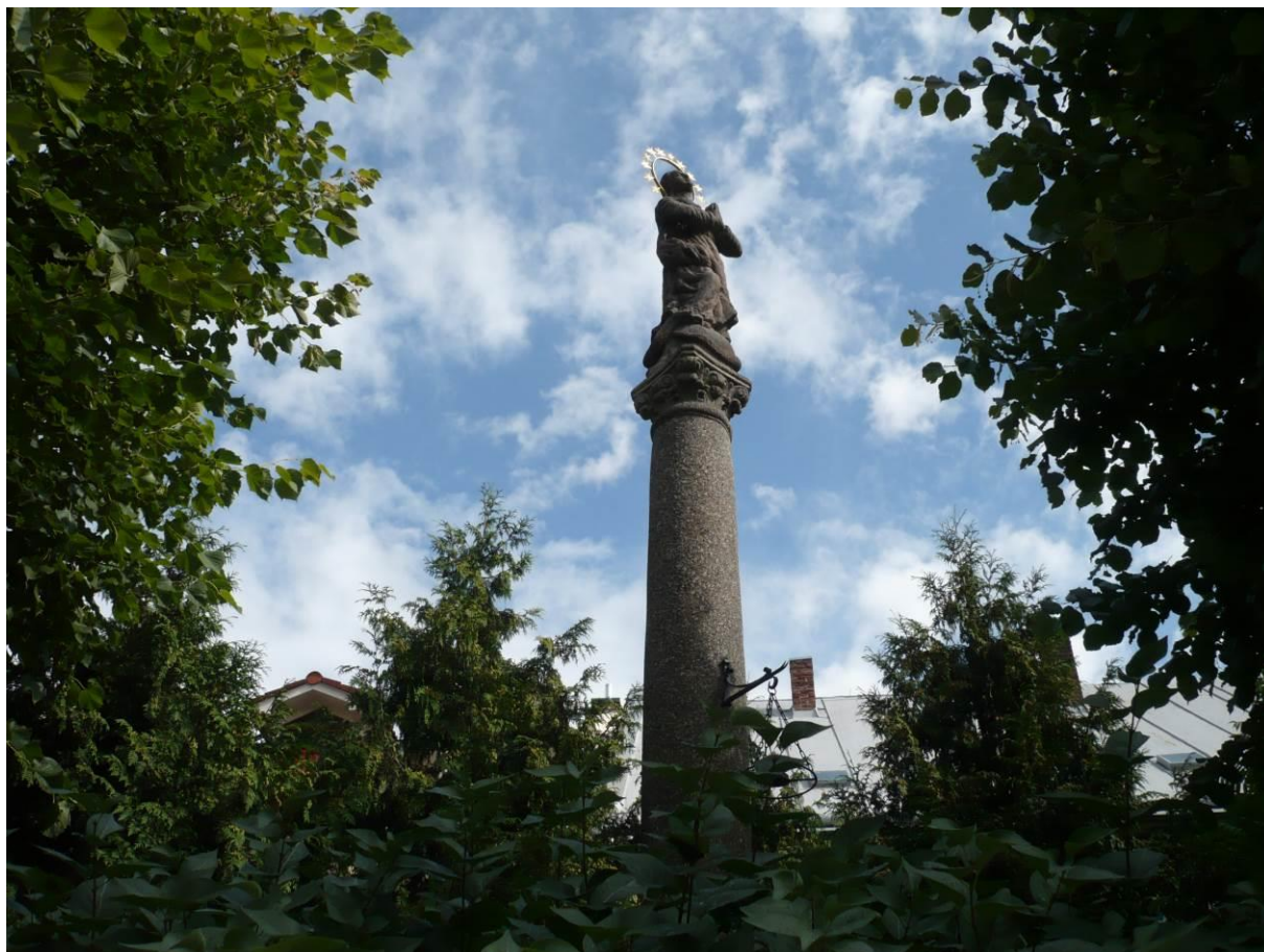
Sloup se sochou Panny Marie, Hornoměstská, Velké Meziříčí

Výsledný efekt: zachování kulturně historických hodnot