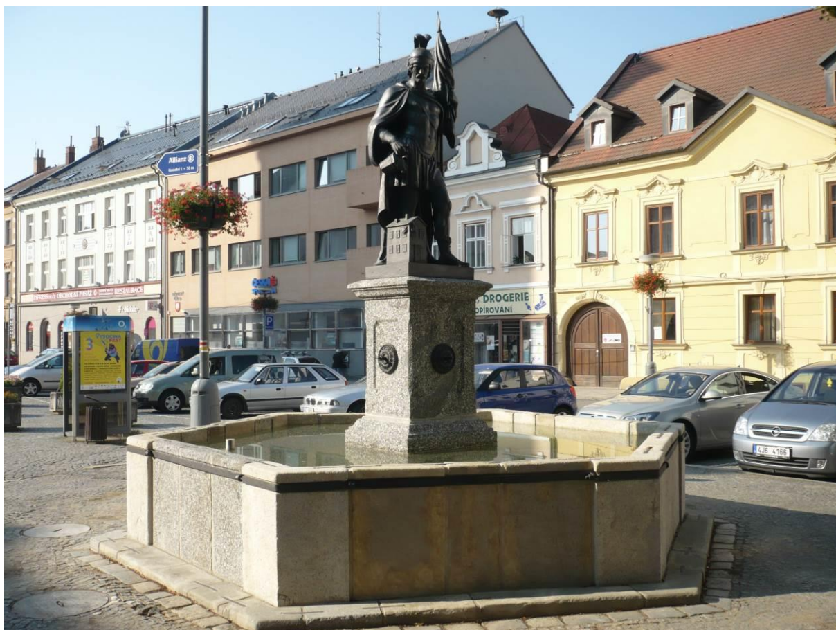
Kašna se sochou sv. Floriána, Náměstí, Velké Meziříčí