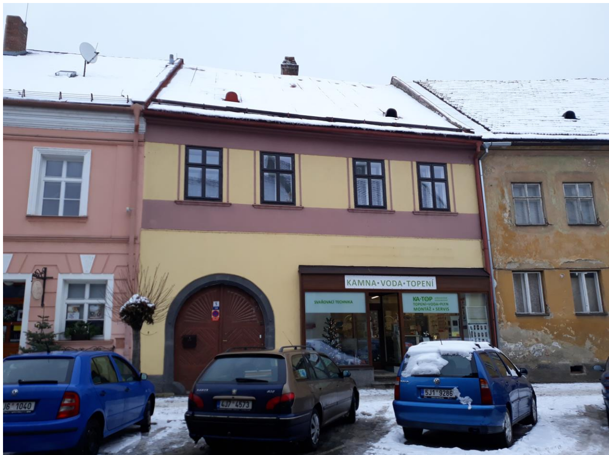
Měšťanský dům č.p. 119, Komenského, Velké Meziříčí