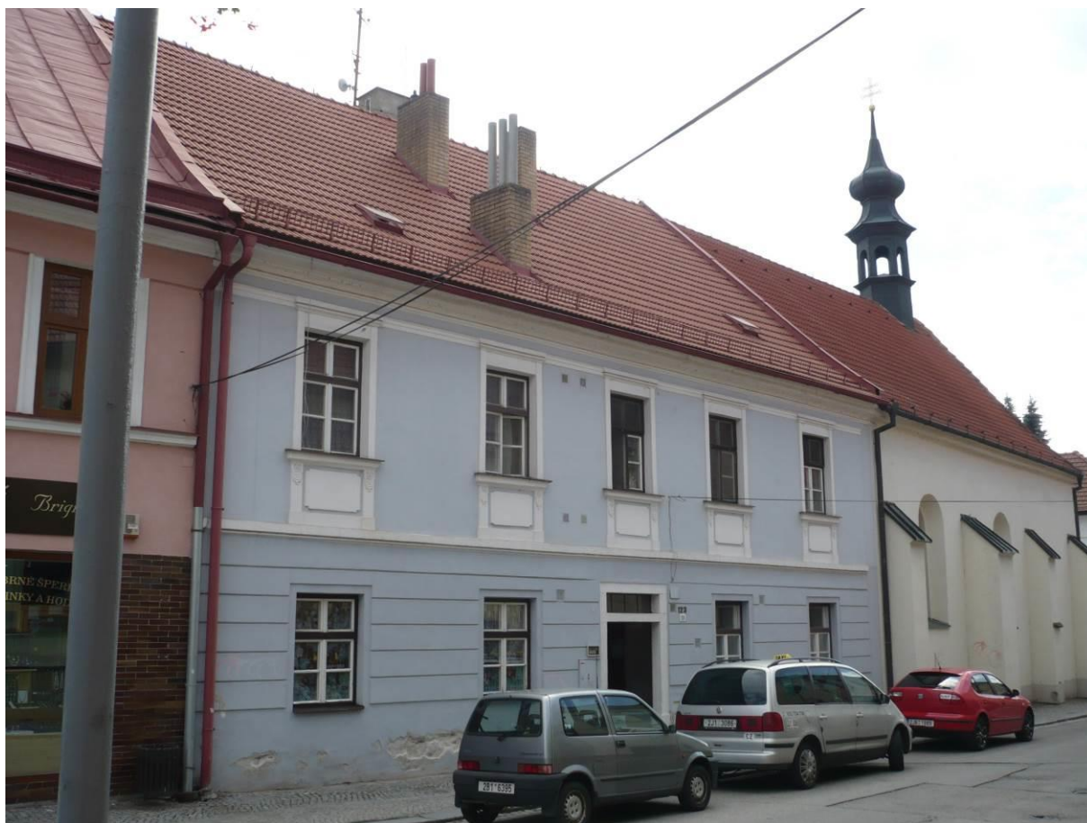
Bývalý špitál, dům č.p. 123, Komenského, Velké Meziříčí

Výsledný efekt: zachování kulturně historických hodnot objektu, zlepšení jeho vzhledu