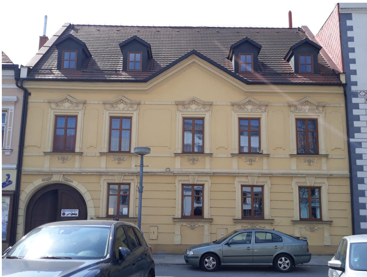
Fara č.p. 16, Náměstí, Velké Meziříčí