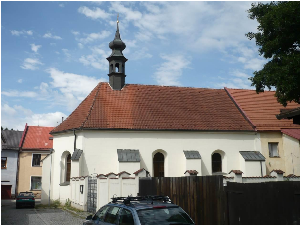
Špitální kostel sv. Kříže, Komenského, Velké Meziříčí