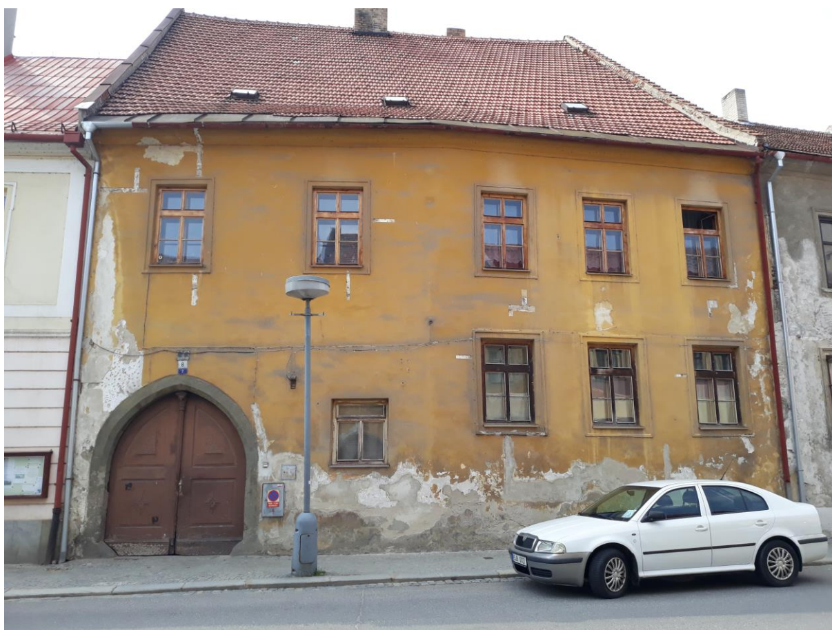
Městský dům č.p. 7, Komenského, Velké Meziříčí

Výsledný efekt: zachování a zlepšení prezentace kulturně historických hodnot objektu, zlepšení stavebně technického stavu domu