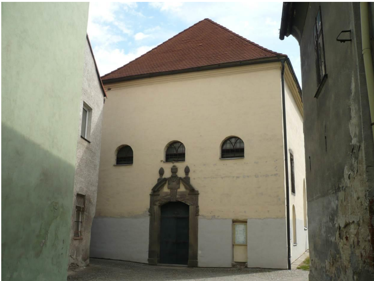
Vstup do synagogy ve Velkém Meziříčí