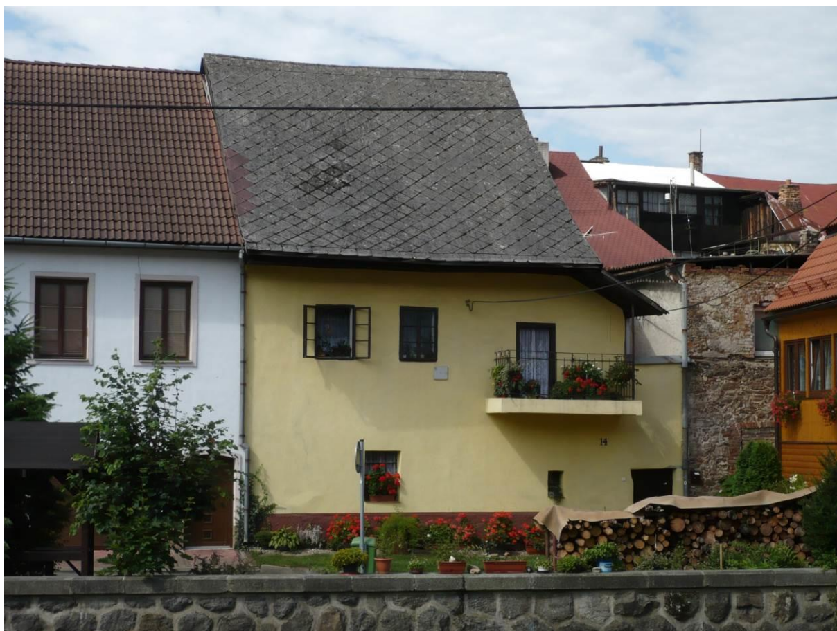
Židovský dům č.p. 1187, U Vody, Velké Meziříčí

Výsledný efekt: zachování a lepší prezentace kulturně historických hodnot objektu, zlepšení stavebně technického stavu budovy