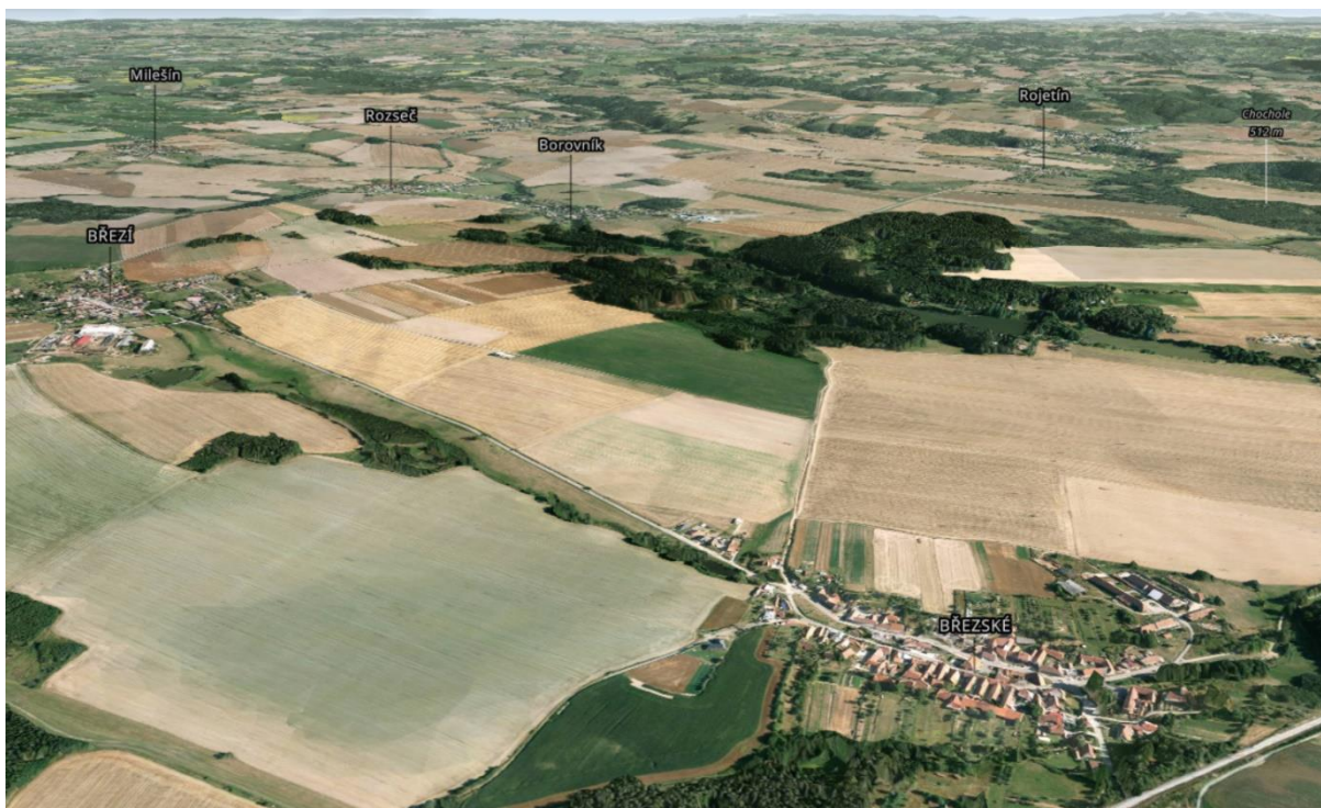
Stávající polní letiště mezi obcemi Březí a Březské