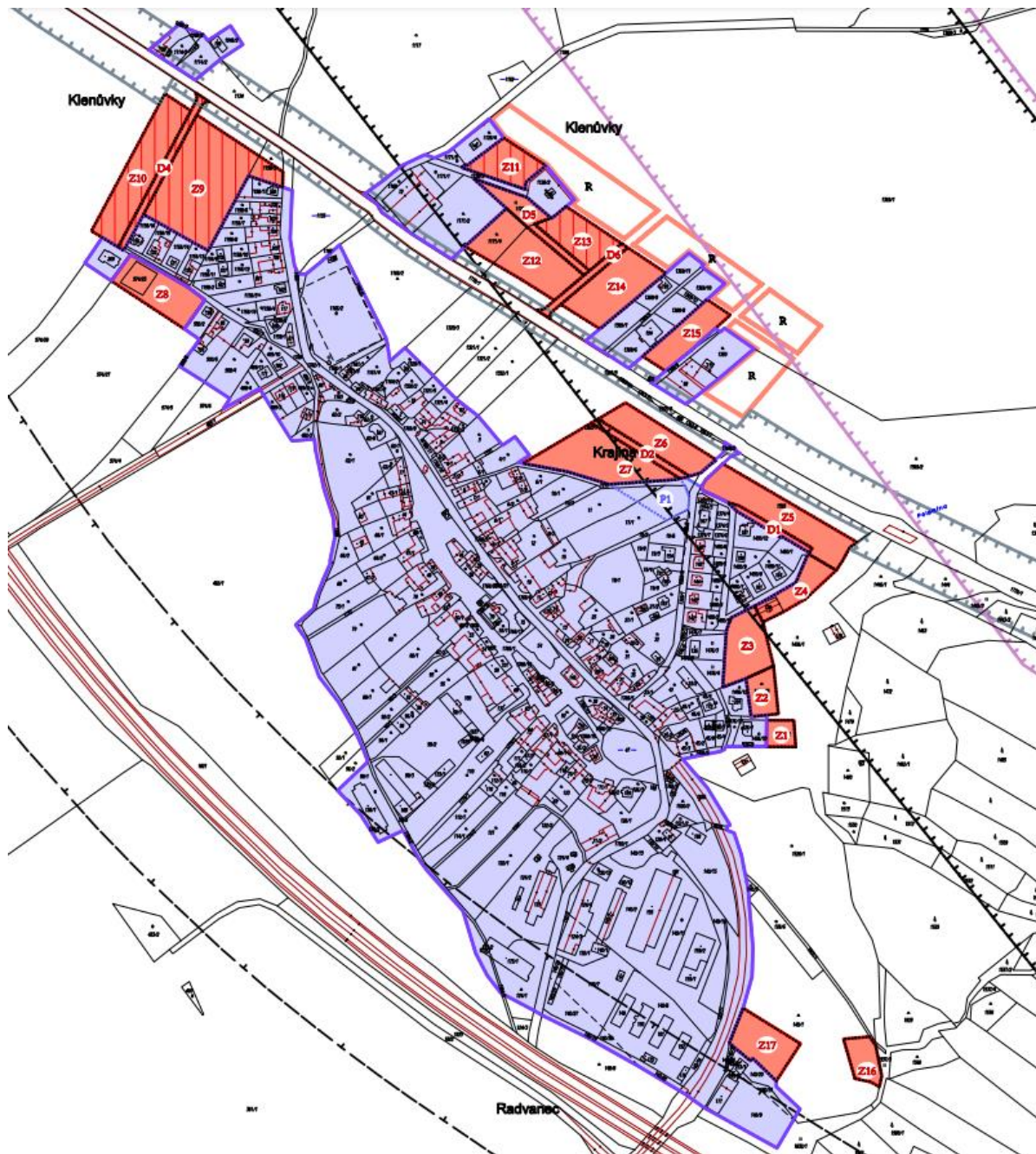
Obr. 2 Výřez z výkresu základního členění – zastavitelné plochy vymezené v ÚP Jablonoň