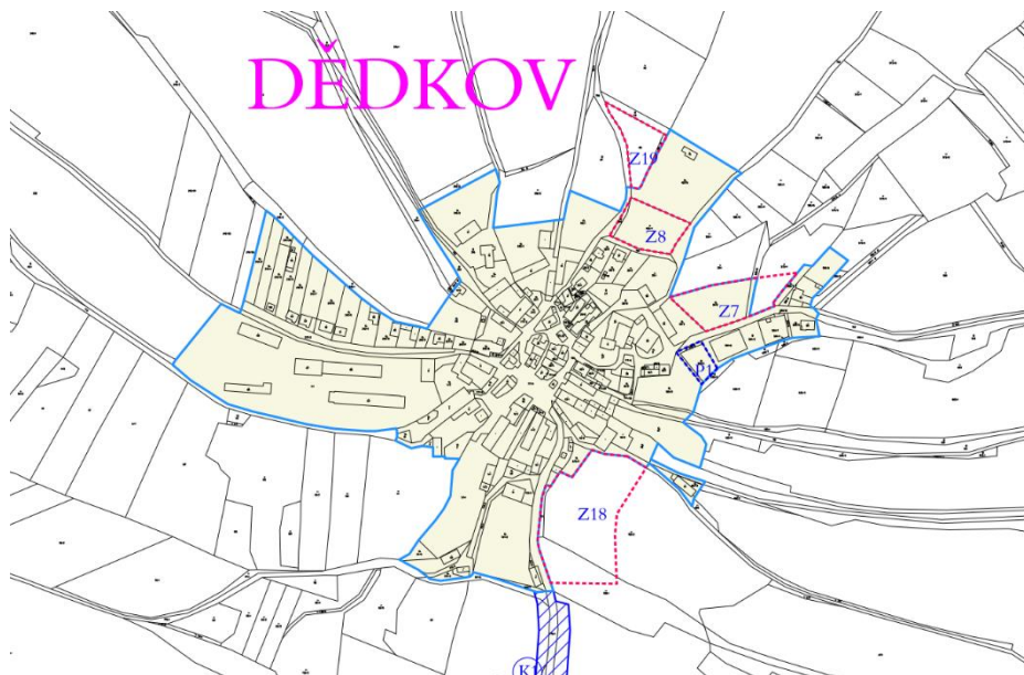
Obrázek 2: Výřez z výkresu základního členění ÚP místní část Dědkov.