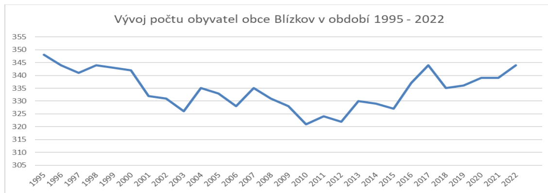
Obrázek 3: Graf vývoje počtu obyvatel v obci Blížkov, data jsou vždy k 31. 12. 2022 (Zdroj: Český statistický úřad; http://vdb.czso.cz/ ).

Rozvoj obce s ohledem na vývoj počtu obyvatel je znázorněn grafem (viz. Obr. 1). Počet obyvatel v obci Blížkov měl do roku 2003 klesající charakter. Od té doby se počet obyvatel pohyboval okolo 330 obyvatel, v posledních letech je patrná vzrůstající tendence počtu obyvatel.