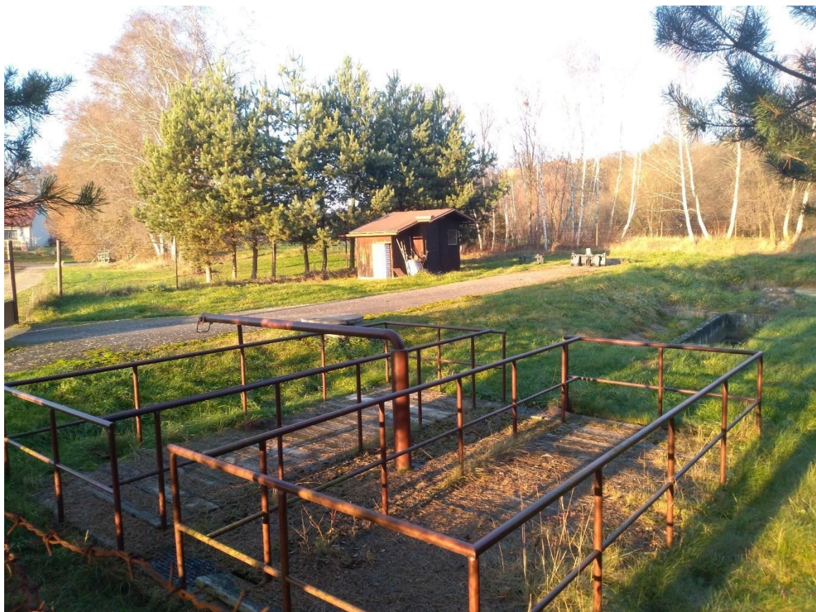
Obr. 1: Čistírna odpadních vod na jihu obce.