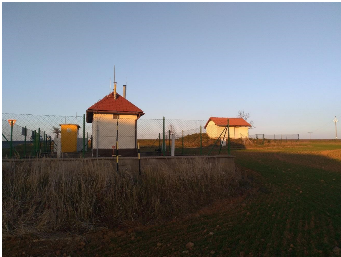
Obr. 5: Vodojem a plynárenské zařízení u výjezdu ze silnice II/379 (zastavitelná plocha Z12).