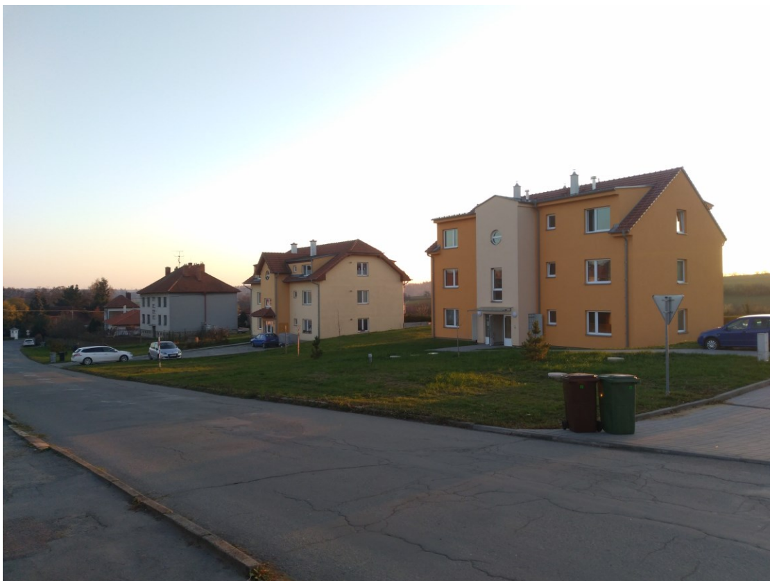
Obr. 8: Tři bytové domy naproti sokolovně (první zprava v zastavitelné ploše Z1).