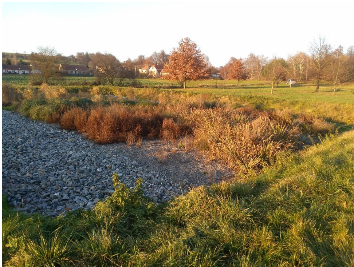
Obr. 3: kořenová čistírna odpadních vod na jihu obce.