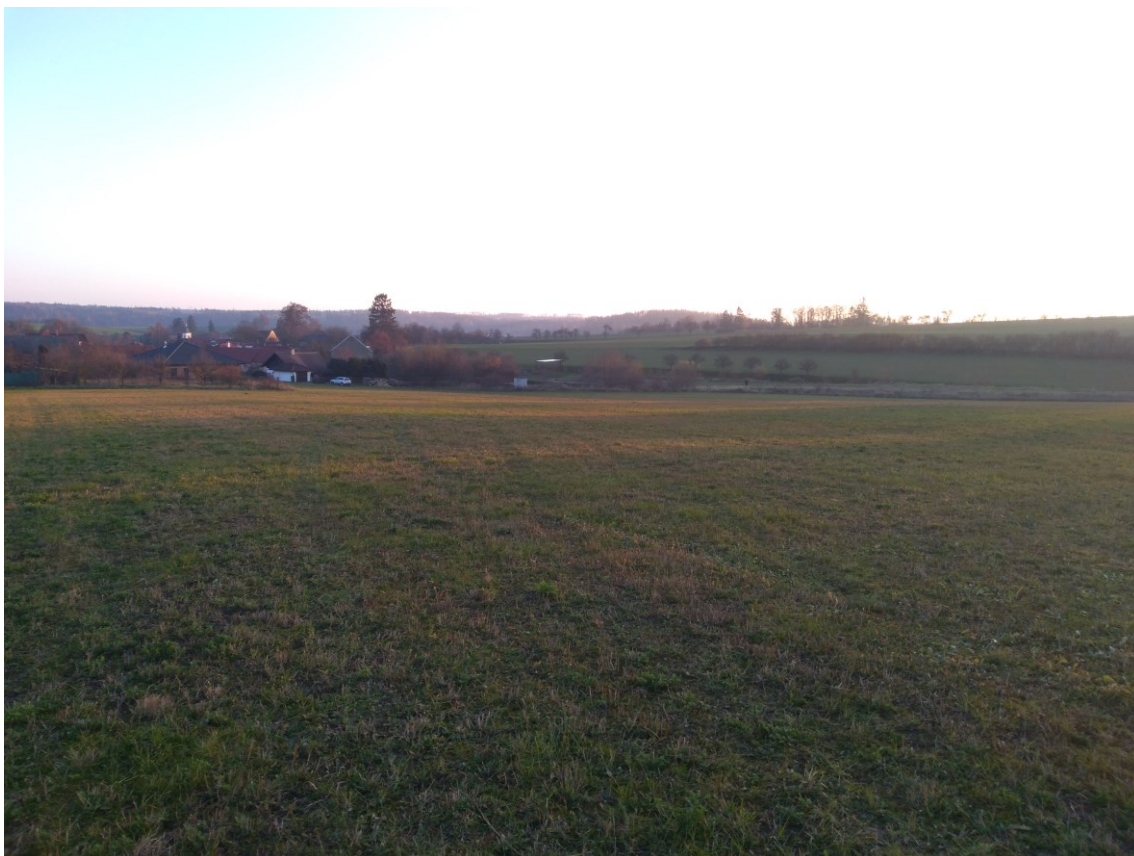
Obr. 7: Pohled ze severu na nevyužitou zastavitelnou plochu Z10.