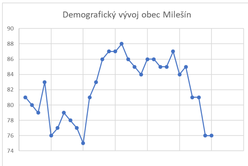
Obr. 1 Vývoj počtu obyvatel obce Milešín za období 1992–2021, (Zdroj: Český statistický úřad, https://www.czso.cz/ )

V ÚP je kladen důraz na rozvoj funkce bydlení a také výroby. Byly vymezeny 4 ploch pro bydlení v rodinných domech a s funkcí obytnou smíšenou. Dále bylo vymezeno 5 ploch pro výrobu a 2 plochy změny v krajině pro výstavbu rybníků. Ve sledovaném období od prosince 2014 do listopadu 2022 byl na zastavitelných plochách vybudován 1 RD. Na ostatních zastavitelných plochách stavební činnost zatím neproběhla. Drobná stavební činnost proběhla v zastavěném území.