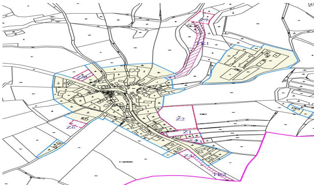
Obrázek 1 Výřez z výkresu ZČÚ, vyznačené zastavitelné plochy v ÚP Radňoves.

Při naplňování ÚP Radňoves od doby jeho vydání nebyly zjištěny negativní dopady na udržitelný rozvoj území. Územní rozvoj obce neohrozil přírodní, krajinné ani kulturní hodnoty území.