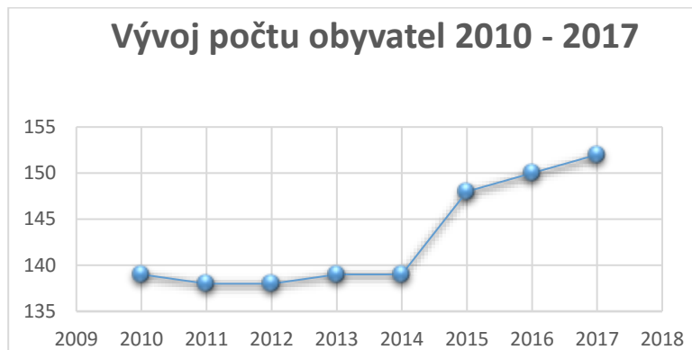
Obr. 3: Graf vývoje počtu obyvatel v obci Skřínářov, data jsou vždy k 31.12..