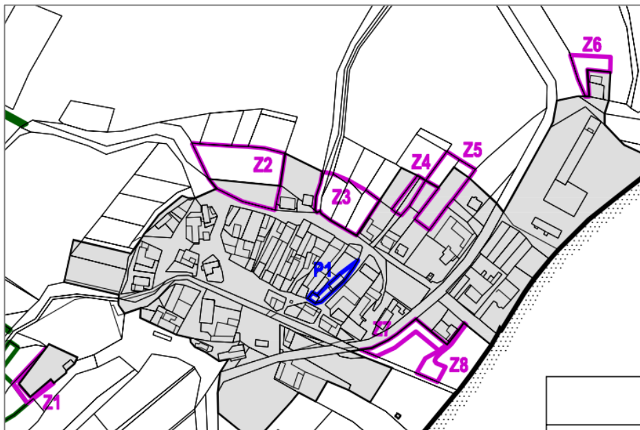
Obr. 1: Zastavitelné plochy a plochy přestavby vymezené ÚP.