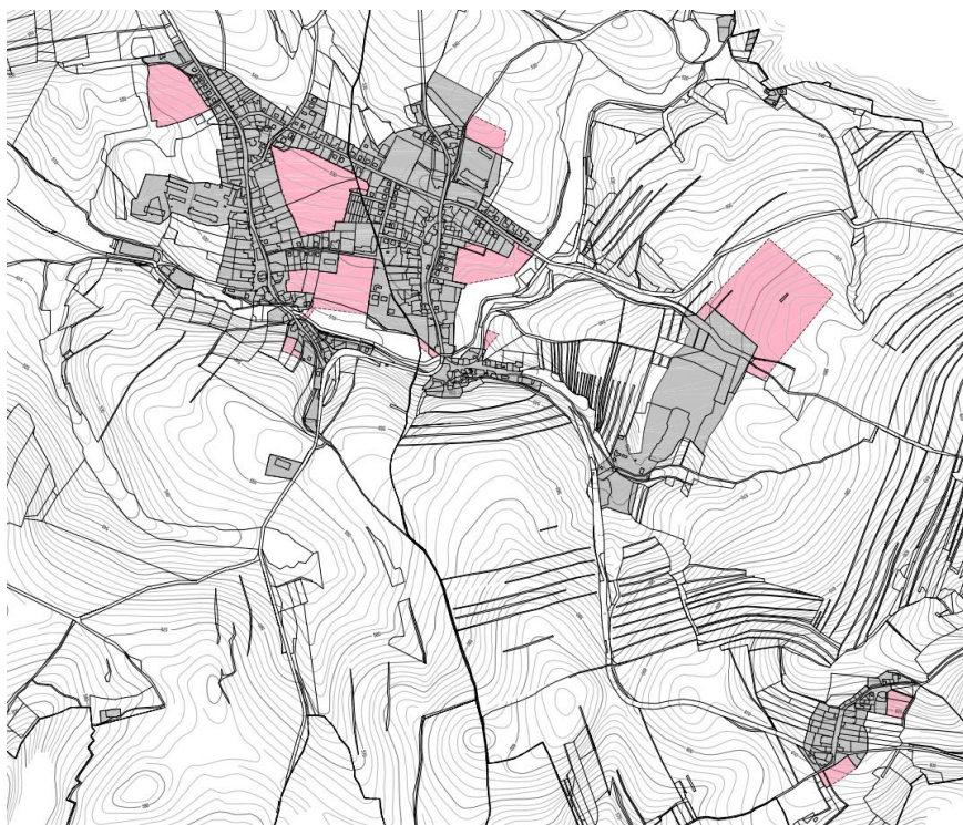
Obr. 1: Zastavitelné plochy vymezené ÚP.

Následující tabulka byla zhotovena podle údajů doložených z registru stavebního úřadu a po konzultaci se starostou obce Bory.