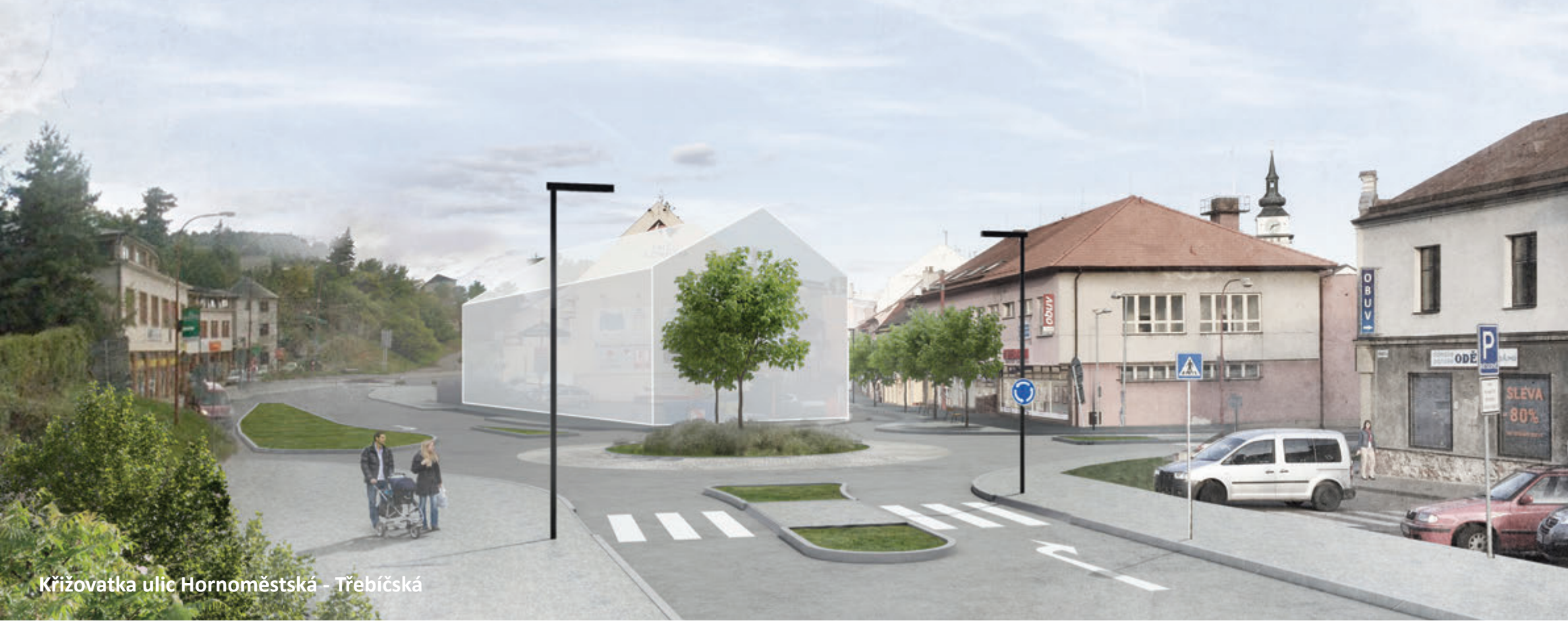
Křižovatka ulic Hornoměstská - Třebíčská