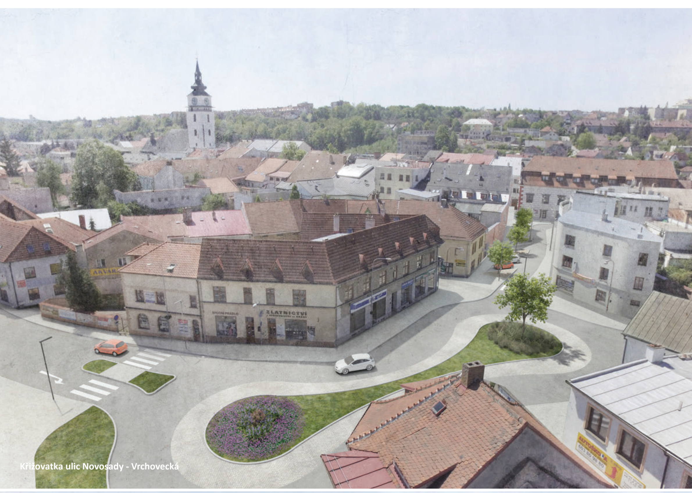
Křižovatka ulic Novosady - Vrchovecká