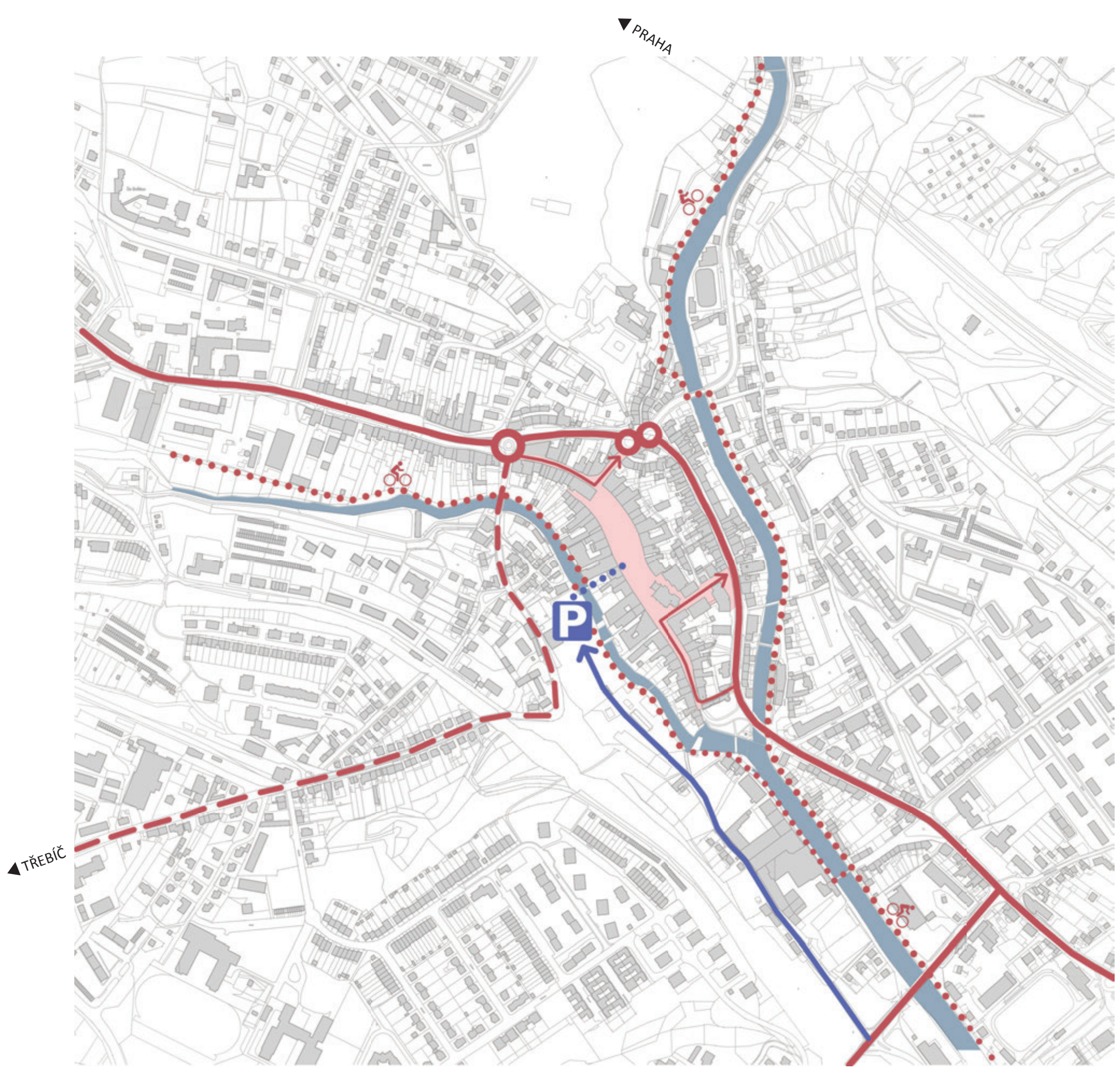
ŠIRŠÍ VZTAHY M 1:5000