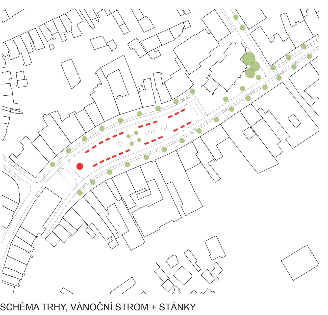
SCHÉMA TRHY, VÁNOČNÍ STROM + STÁNKY