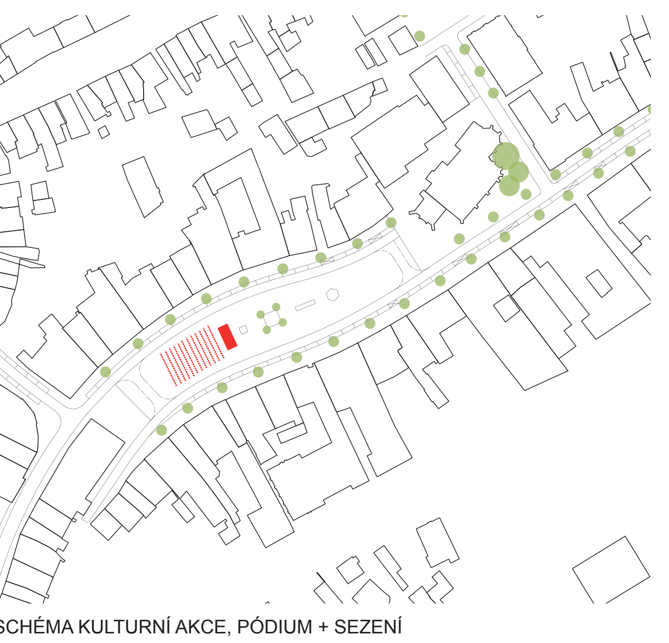
SCHÉMA KULTURNÍ AKCE, PÓDIUM + SEZENÍ