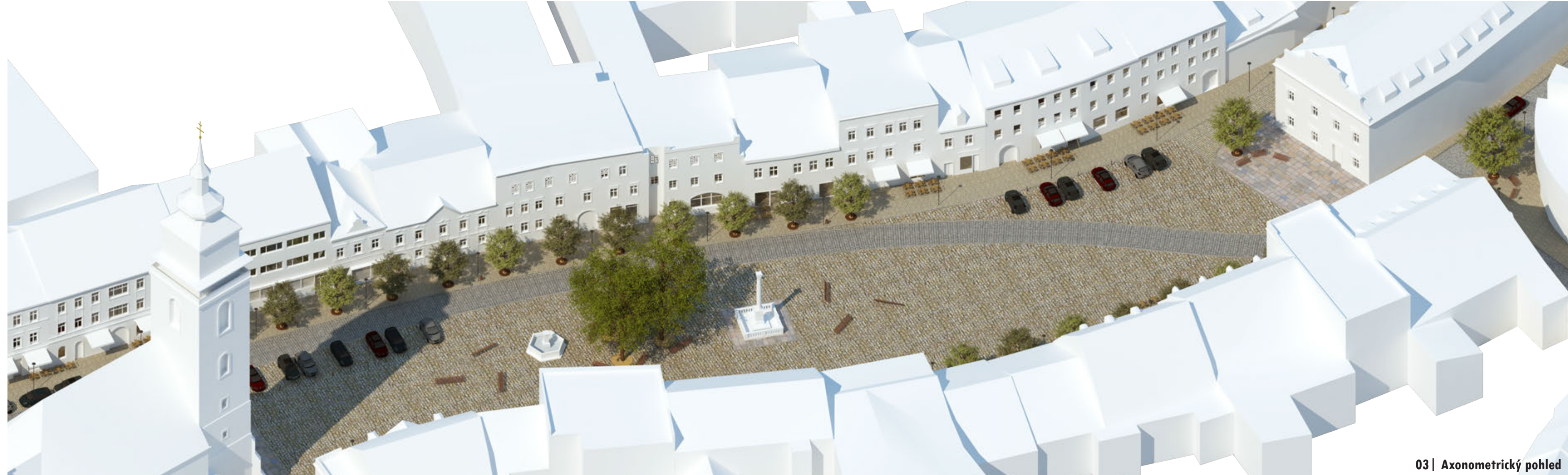
03 | Axonometrický pohled