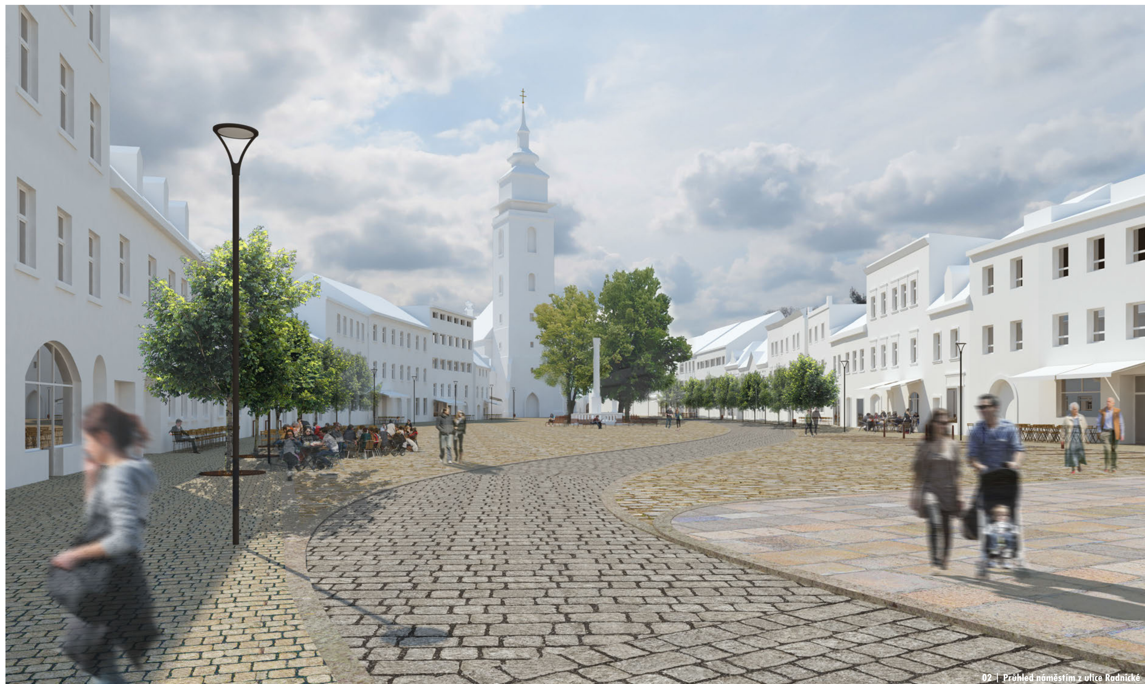
02 | Přehled náměstí z ulice Radnické